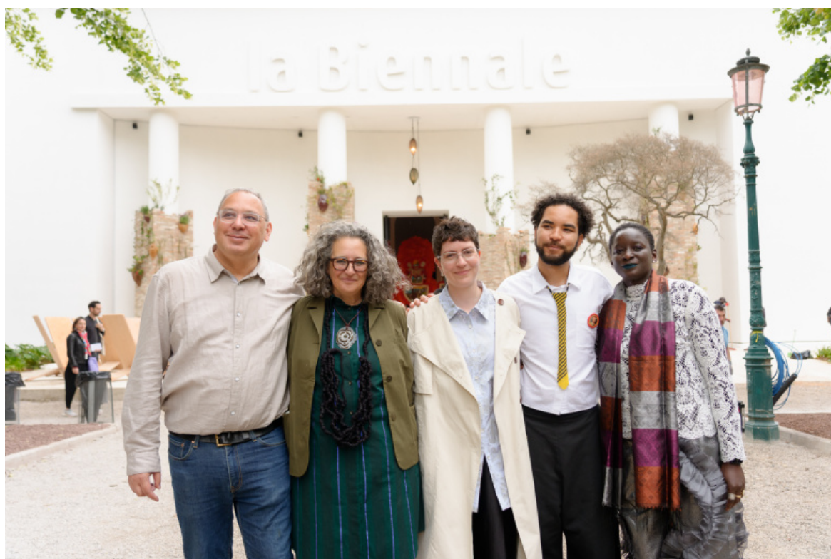
Koyo Kouoh's Team, Photo by Andrea Avezù 6. Esposizione Internazionale d'Arte - La Biennale di Venezia, In Minor Keys, Courtesy La Biennale di Venezia.

Non si creda che le minor keys a cui Kouoh fa riferimento presuppongano necessariamente opere dimesse, sussurrate. La scala è spesso marcata, addirittura monumentale: un modo per tradurre visivamente un processo di riconoscimento e avvaloramento, per generare uno spostamento di sguardo affermando la rilevanza di temi, soggetti, realtà troppo spesso trascurati.