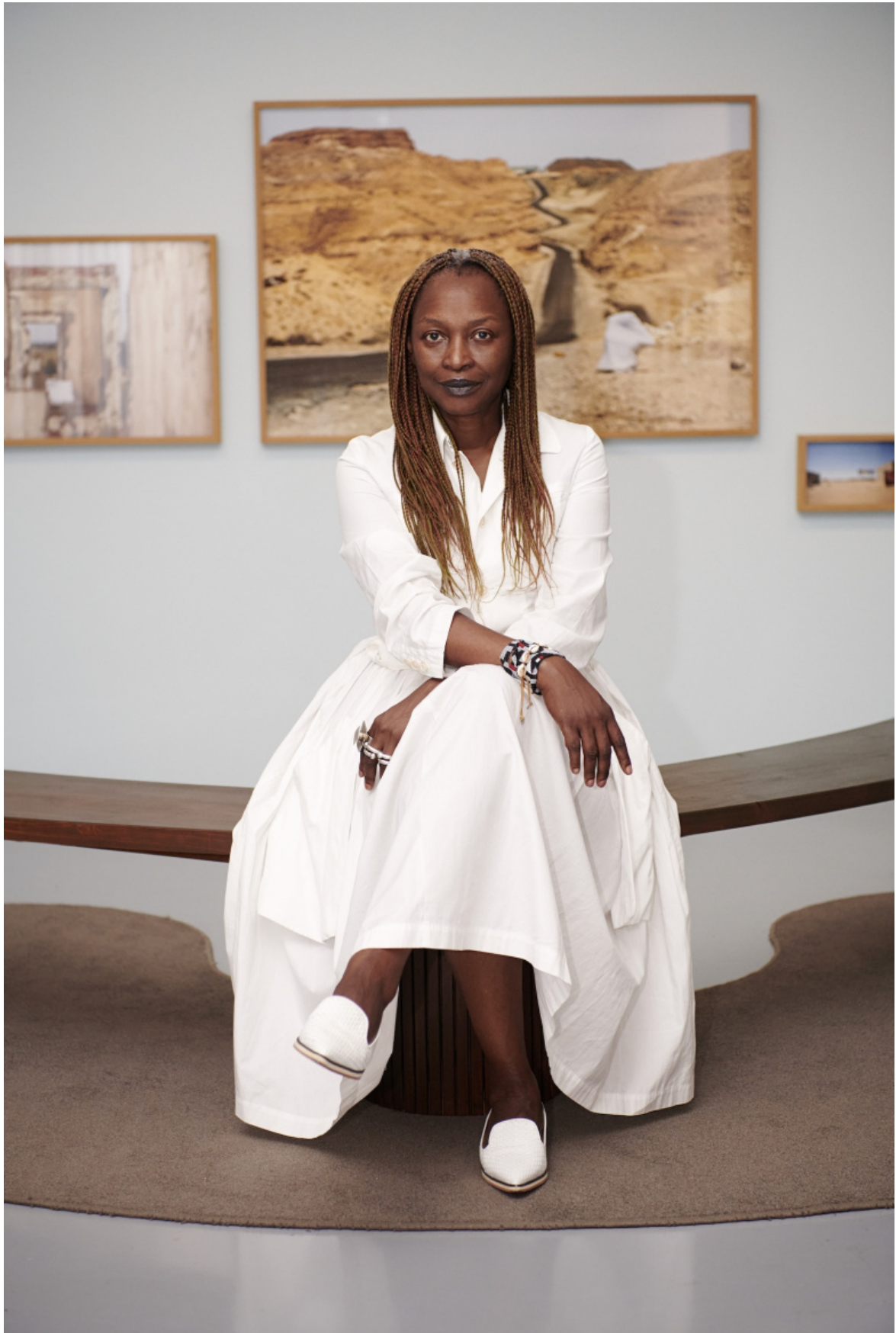
Koyo Kouoh Portrait 61. Esposizione Internazionale d'Arte - La Biennale di Venezia, In Minor Keys.

Per quanto riguarda l'attitudine curatoriale, Kouoh non ha semplicemente individuato nomi e opere che potessero sostenere una scelta tematica, ma ha