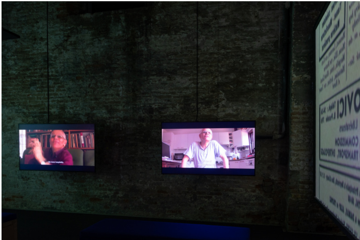
MOGRABI AVI, Between a river and a sea , photo by Luca Zambelli Bais 61. Esposizione Internazionale d'Arte - La Biennale di Venezia, In Minor Keys , Courtesy La Biennale di Venezia.

poesia dell'opera in sé: come a dire che solo dalla piena fusione di forma e contenuto può nascere quella potenza espressiva che permette di veicolare messaggi, di restituire senso all'immaginazione e al desiderio, di indicare alternative al collasso dell'orizzonte di cui oggi si sperimentano gli effetti.