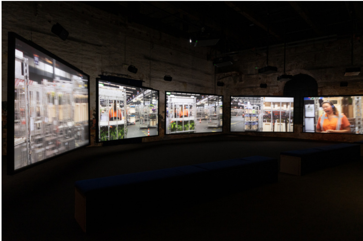
BAUDELAIRE ÉRIC, Death Passed My Way and Stuck This Flower in my Mouth, Photo by Luca Zambelli Bais 61. Esposizione Internazionale d'Arte - La Biennale di Venezia, In Minor Keys, Courtesy La Biennale di Venezia.

Insomma, tono definito, scelte curatoriali orientate e sicure, opere cariche e fortemente caratterizzate, variegata dal punto di vista del linguaggio, ma connesse da una frequenza comune. L'allestimento è di una densità di primo acchito spiazzante, ma genera una sensazione di continuo colloquio tra le opere. Il senso si può forse trovare nel ripetuto riferimento, nei testi della curatrice, alla musica e soprattutto al jamming e al jazz: generi basati sul dialogo tra i musicisti, sull'ascolto reciproco e sull'interferenza. Come dire che la concreta possibilità di visioni nasce nell'esperienza comune.