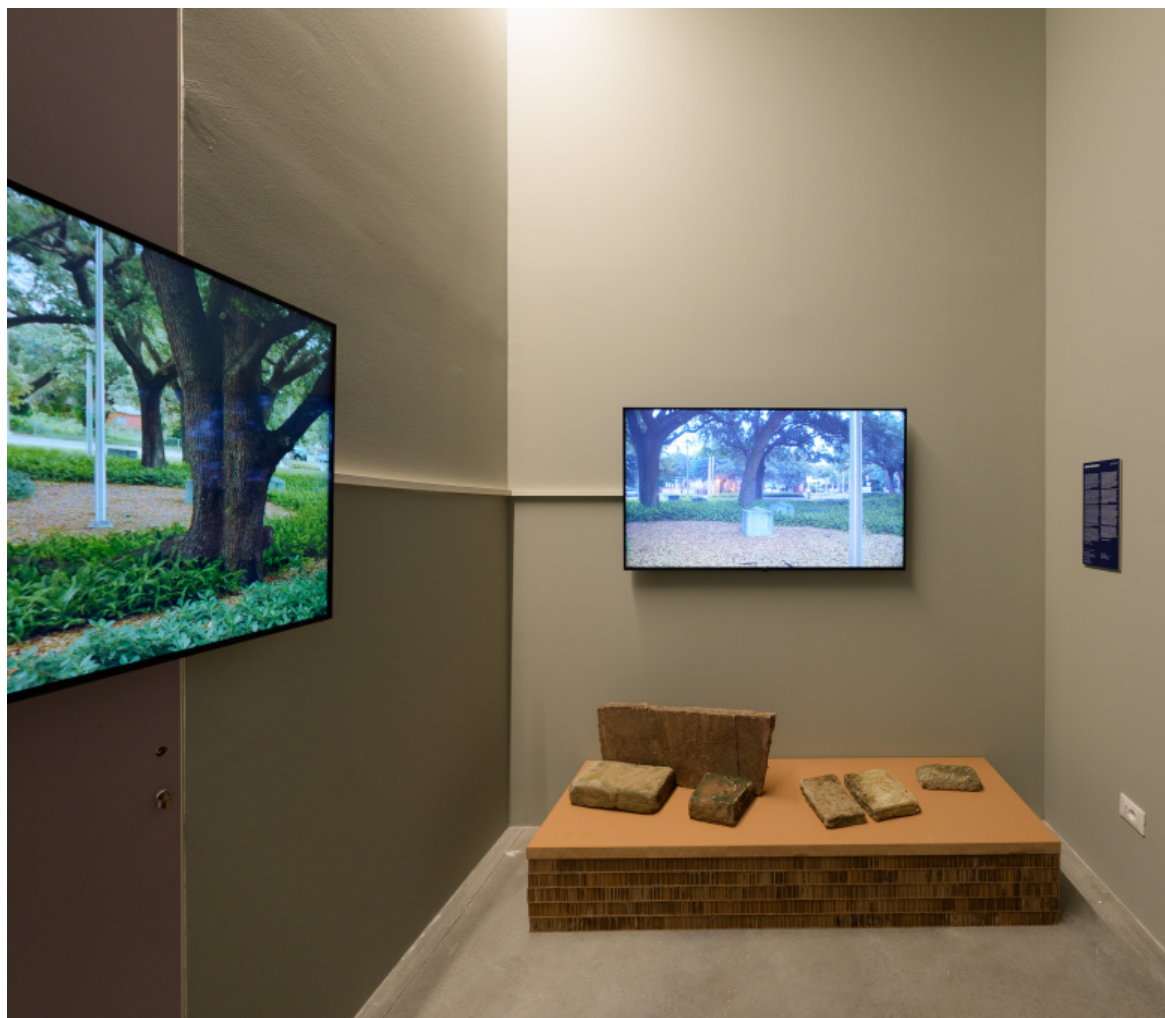
Beverly Buchanan, installation view, Photo by Andrea Avezzi 61. Esposizione Internazionale d'Arte - La Biennale di Venezia, In Minor Keys _ Courtesy La Biennale di Venezia.

proposta di rappresentarlo simbolicamente “portandolo con sé” a Venezia, nell’epicentro dell’arte contemporanea. Per gli scomparsi, le informazioni erano state raccolte attraverso persone che li avevano conosciuti.