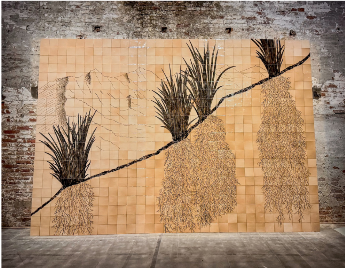
Uriel Orlow, Holding the Mountain , photo by Uriel Orlow 6. Esposizione Internazionale d'Arte - La Biennale di Venezia, In Minor Keys , Courtesy l'artista.

dall'ospedale psichiatrico Kfar Shaul di Gerusalemme. Inizialmente specializzato nel trattamento delle vittime dell'Olocausto, tra cui un parente dell'artista stesso, Kfar Shaul fu fondato nel 1951 sui resti del villaggio palestinese di Deir Yassin, dopo il massacro dei suoi abitanti. Unmade Film affronta dunque la questione del trauma e del doloroso perpetuarsi della violenza. Le altre opere di Orlow insistono sul rapporto tra passato e futuro, con le sue implicazioni storiche e geopolitiche, facendo riferimento alla botanica. Nella sommersa performance Reverie Of Collective Walkers (Reading To Plants) l'artista e altri partecipanti, chini sulle piante del Giardino delle Vergini, hanno letto loro brani poetici e letterari.