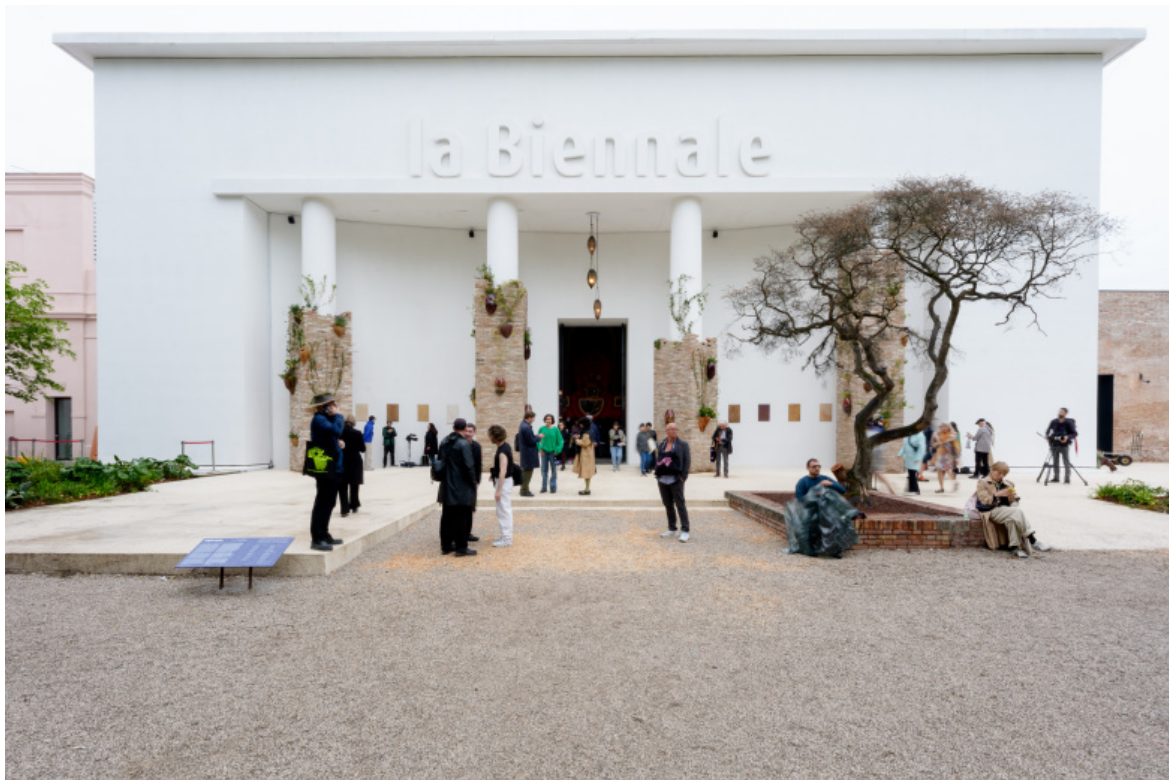
Otobong Nkanga, Soft Offerings to Silenced Voices and to All Who Have Turned to Dust, Photo by Andrea Avezù 61. Esposizione Internazionale d'Arte - La Biennale di Venezia, In Minor Keys, Courtesy La Biennale di Venezia.

Ai Giardini Otobong Nkanga ha impiantato sulle colonne del portico modernista del Padiglione centrale dei vasi con piante che, crescendo, ne faranno un pergolato. Mentre il piccolo Giardino delle Sculture di Carlo Scarpa diventa vivibile spazio di sosta grazie alla collocazione di alcune rocce che fanno sia da sedute, sia da vaso per piante aromatiche: un'allusione alla possibilità di vivere in armonia con la natura.