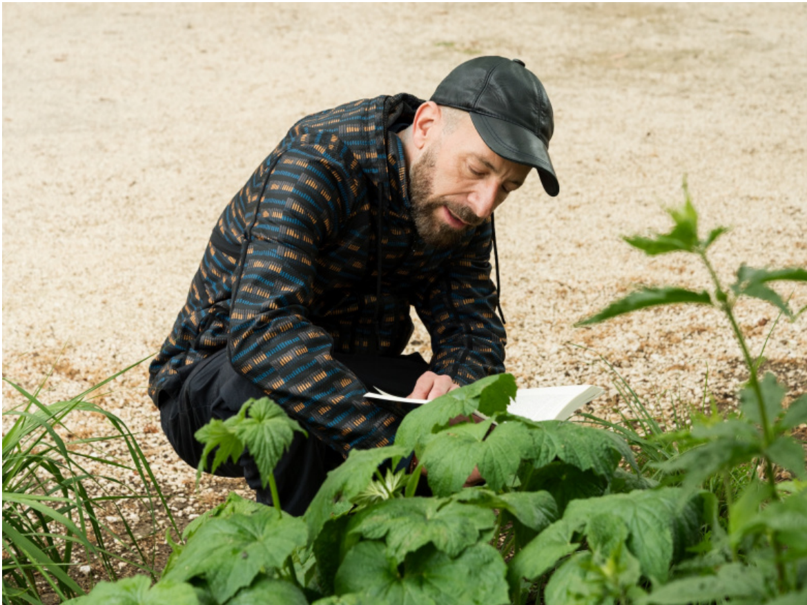
Uriel Orlow, performance photo by Renato Chorão 61. Esposizione Internazionale d'Arte - La Biennale di Venezia, In Minor Keys, Courtesy l'artista.

Le piante come interlocutori sono presenti anche in altre opere, come il video di Florence Lazar It's All Thanks to Bad Weather : un documentario incentrato su un'area costiera, in Martinica, dove nel 2007 per via di un uragano è tornata alla luce una necropoli di epoca coloniale con resti di lavoratori schiavi delle piantagioni di zucchero. Un collettivo cittadino esige il ritorno dei resti di questi individui, finora considerati "beni mobili" e dichiarati proprietà dello Stato francese, alla terra dei loro avi. Nel video un agricoltore si confronta con un albero antico, che di questa storia è stato testimone.