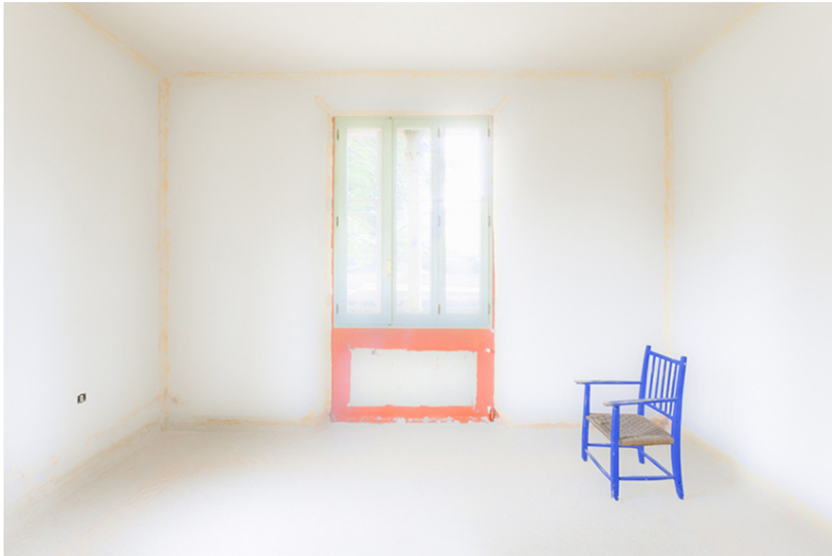
Blank #2835, 2009.

EG: Blank è la tua serie più nota e quella che ti identifica di più: il bianco, il vuoto, il silenzio, la sospensione, che diventano però passaggio e trasfigurazione, anche nel senso di trans-figurazione.