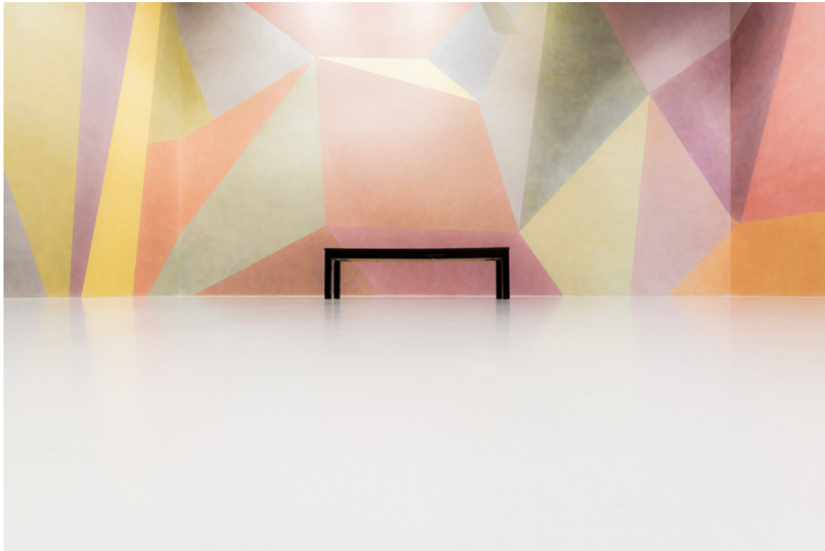
Untitled #8979, 2018.

EG: Ed ecco un'altra panca. Ma questa volta niente colonne bensì una pittura murale di Sol LeWitt. Il bianco è passato sotto.