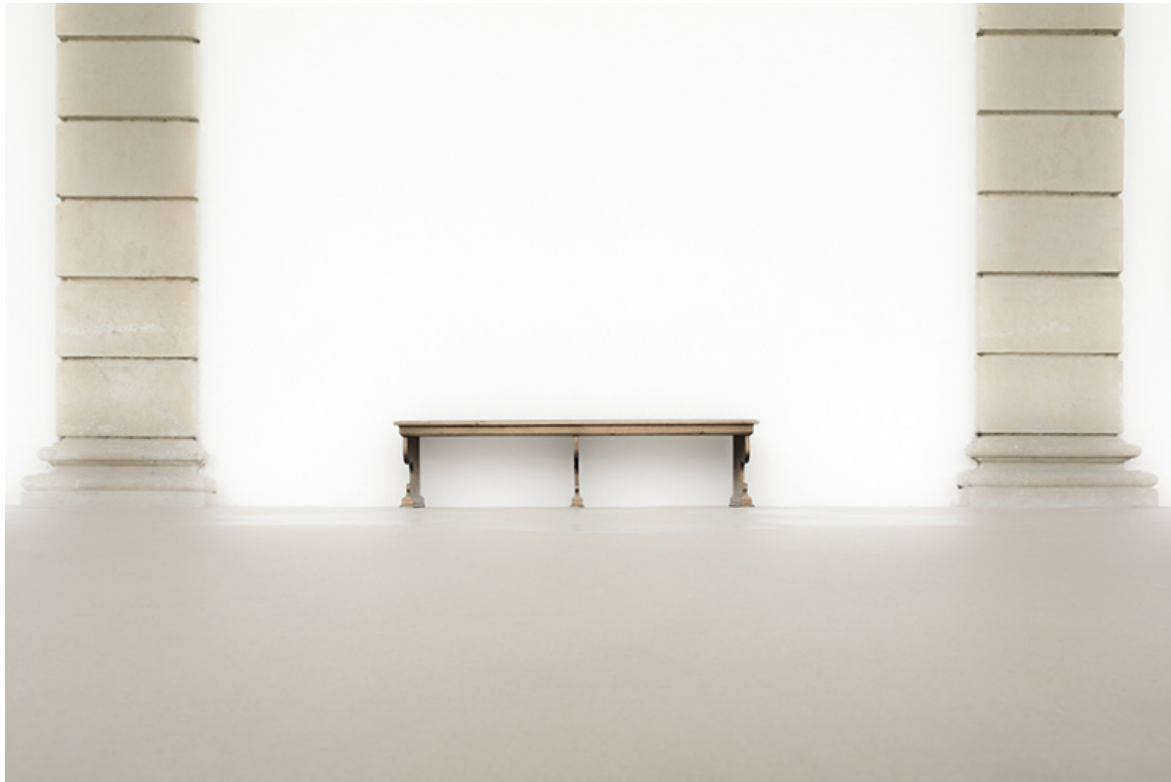
Untitled #5961, 2016.

EG: Grazie a quella precedente qui il bianco sembra al tempo stesso sfondo e ritaglio inquadrato dalle due colonne.