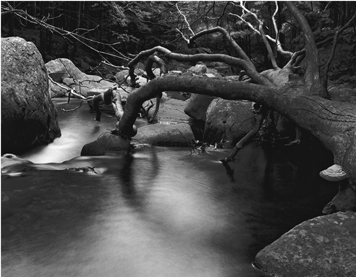
Silenzi di forme, Torrente Parma di Badignana (PR), 2002.