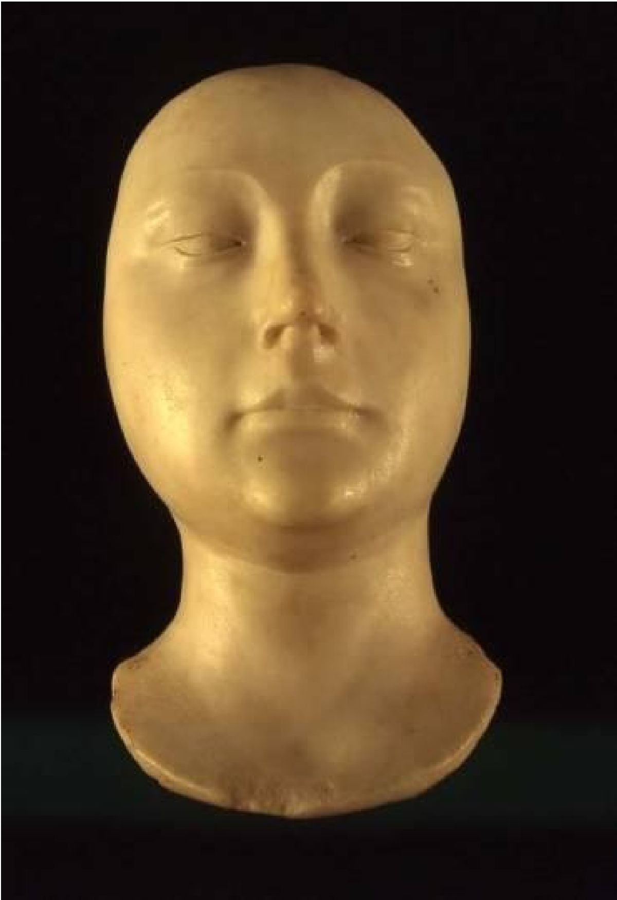
Francesco da Laurana, Masque de femme, ultimo quarto XV sec., marmo, Chambéry, Musée des Beaux-Arts

Il museo è, per antonomasia, luogo di immagini culturali sedimentate e che necessitano di una riattivazione per sopravvivere. Ma le stesse immagini sono “luoghi”, pellicole visive che tremano e si tendono, donando profondità a ciò che il mezzo fisico supporta.