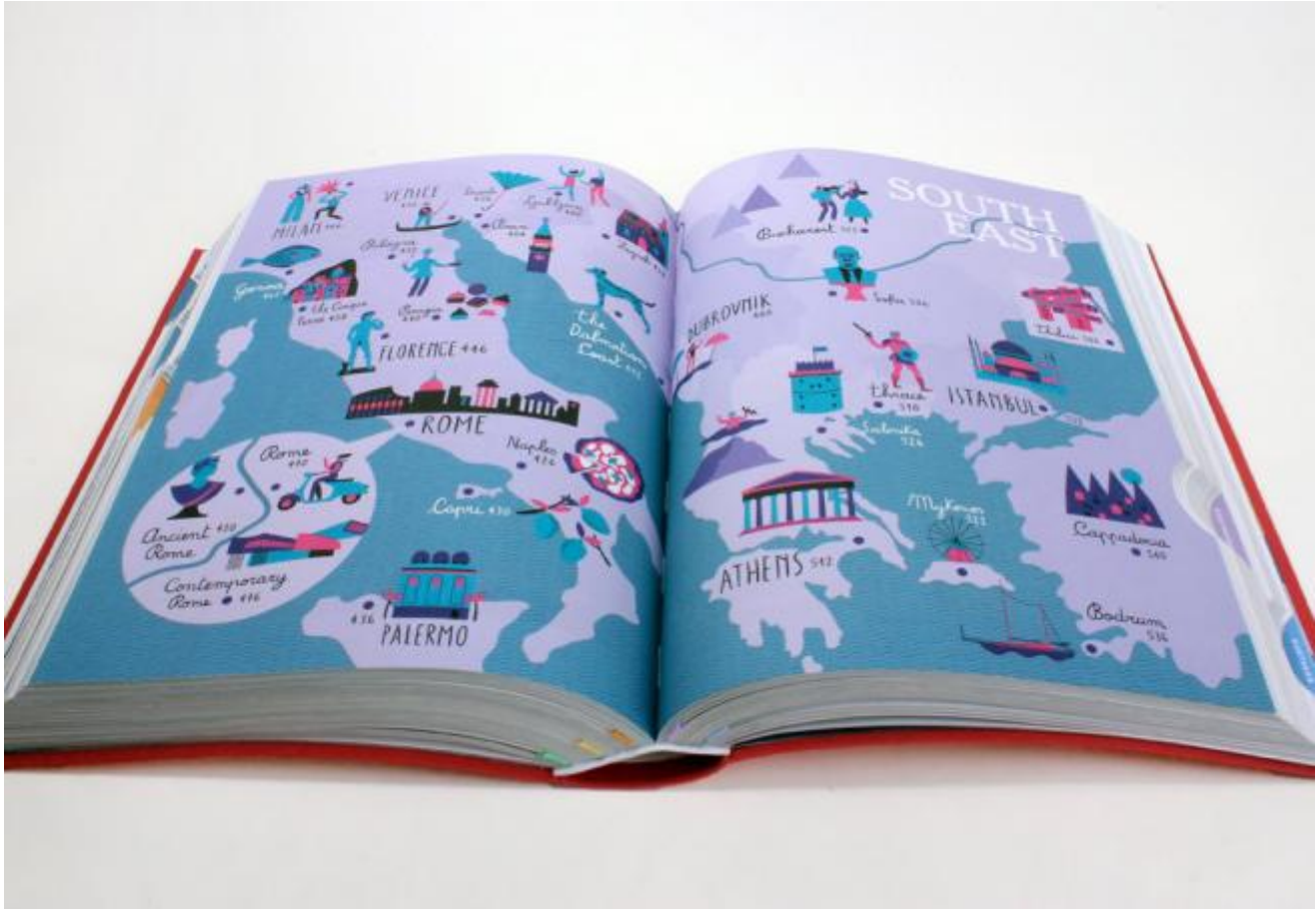
Illustrazione per la guida del The New York Times 36 Hours - 125 Weekends in Europe