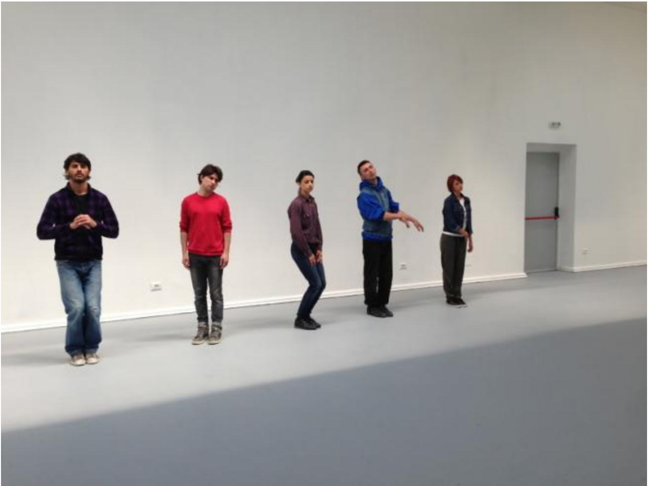
Padiglione della Romania