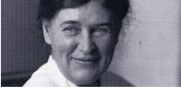
WILLA CATHER PIONIERI