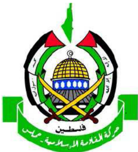
09. HAMAS P. 131

Il branding è uno strumento senza coscienza o moralità; può essere usato a scopi sia positivi sia negativi, a volte in contemporanea”. E così come ogni brand lavora per eliminare ogni possibile divario fra l’identità di sé che tende a veicolare e l’immagine che ne viene percepita dal pubblico, analogamente i terroristi devono