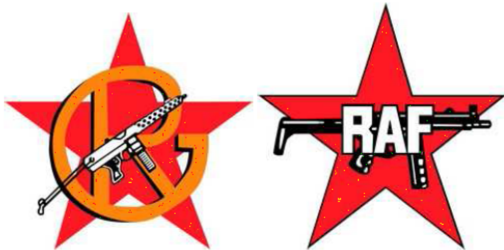
08 A e B. GRUPOS DE RESISTENCIA ANTIFASCISTA P.125

Così, i gruppi terroristici sono grandi produttori di segni, alla stregua delle aziende commerciali o delle istituzioni pubbliche, e come tali devono saperli maneggiare con cura, ai propri fini specifici, di tipo, appunto, promozionale e comunicativo. Analogamente a qualsiasi brand, la scelta dei logo, per essi, non è accessoria ma consustanziale. Lo dice anche Heller nella prefazione con grande chiarezza: “questi gruppi terroristici sono tutti marchi, e ottengono una certa possibilità di sopravvivenza grazie a metodi legati al branding.