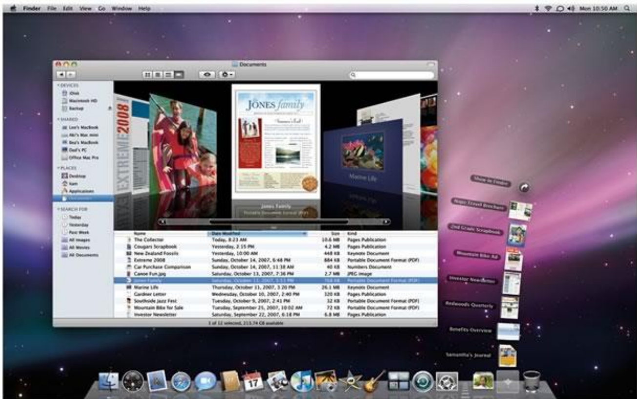
Mac OS X Leopard

Seguendo la linea di pensiero esposta sopra, dal Mac OSX in poi, comincia quello che può facilmente identificarsi come il “periodo manierista dei sistemi operativi”. Se il Manierismo nelle arti visive ebbe le sue ragioni di esistere e certamente non può essere giudicato come giusto o ingiusto, nemmeno è il caso per i sistemi operativi; tuttavia, trattandosi di una interfaccia attraverso la quale potenzialmente tutte le nostre produzioni culturali vengono filtrate oggi – cinema, musica, testi, comunicazione, etc. etc. ( Manovich 2001: 75 ), questa situazione appare meno innocente, e deve sicuramente essere considerata con più attenzione.