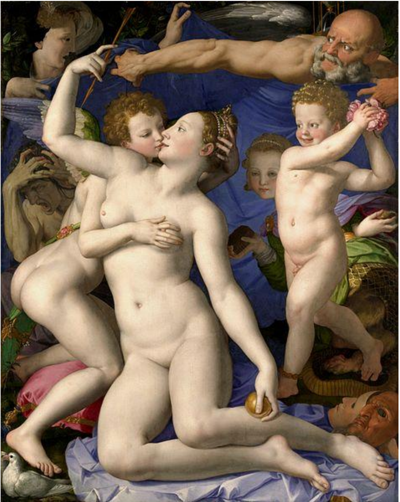
Bronzino (Agnolo di Cosimo), Allegoria del trionfo di Venere (1540-1545)

Molto spesso, il tema dell'opera era difficile da decifrare, e gli spazi e le figure dipinti erano incoerenti o molto distorti, come ad esempio è il caso di La Madonna dal collo lungo (1534-1540) del Parmigianino, o l' Allegoria del trionfo di Venere (1540-1545) del Bronzino. Perciò, in un certo senso, le rappresentazioni manieriste tendono a spostare l'attenzione dal nucleo più importante, o pertinente, a sezioni confuse, altamente finzionali e distorte della composizione.