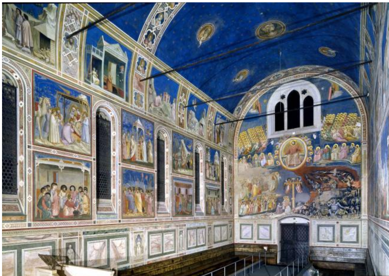
Giotto, Cappella degli Scrovegni (1303-1305)

Nel suo articolo Tesi sul racconto lo scrittore e teorico letterario Ricardo Piglia propone l'idea che "un racconto narra sempre due storie". Nel caso del racconto classico (Edgar A. Poe, Horacio Quiroga), per esempio, lo scrittore "narra in primo piano la storia 1, e segretamente costruisce la storia 2. L'arte del narratore consiste nel cifrare la storia 2 negli interstizi della storia 1. Una narrazione visibile ne nasconde una segreta, raccontata in modo ellittico e frammentario" (Piglia n.d.). Ogni narratore gestisce in modo diverso il rapporto tra storia 1 e storia 2; tuttavia, la Seconda tesi di Piglia è che "la storia segreta sia la forma del racconto".