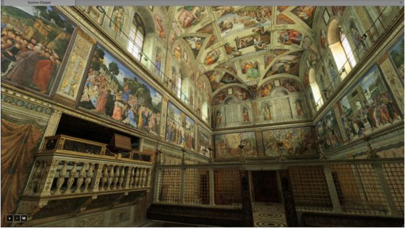
Michelangelo Buonarroti, Cappella Sistina (1508-1512)

Secondo Manovich “creare un’opera in new media può essere inteso come creare un’interfaccia che permetta l’accesso a un database. [...] Il database diventa il centro del processo creativo nell’era dei computer. Gli oggetti new media consistono in una o più interfacce al database di materiali multimediali” (Manovich 2001: 20).