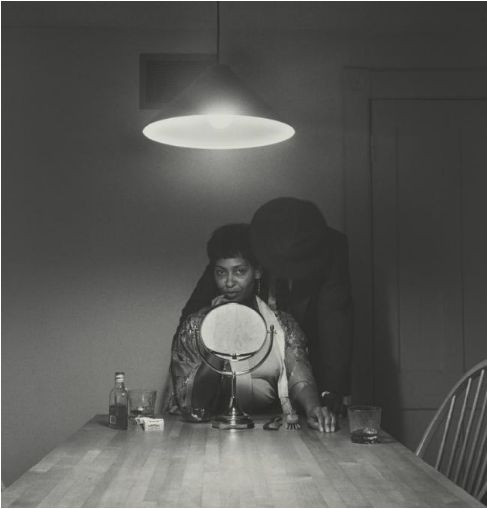
Carrie Mae Weems, Untitled (Man and mirror) (from Kitchen Table Series ), 1990

Esposti negli annessi del secondo e quarto livello del museo, oltre a seguire la maturazione umana dell'artista stessa, presente in molte fotografie, i lavori tracciano infatti un prezioso profilo della classe media afro-americana e contemporaneamente articolano un'esplicita denuncia delle disuguaglianze e delle ingiustizie sociali e di genere che hanno caratterizzato il panorama americano degli ultimi decenni.