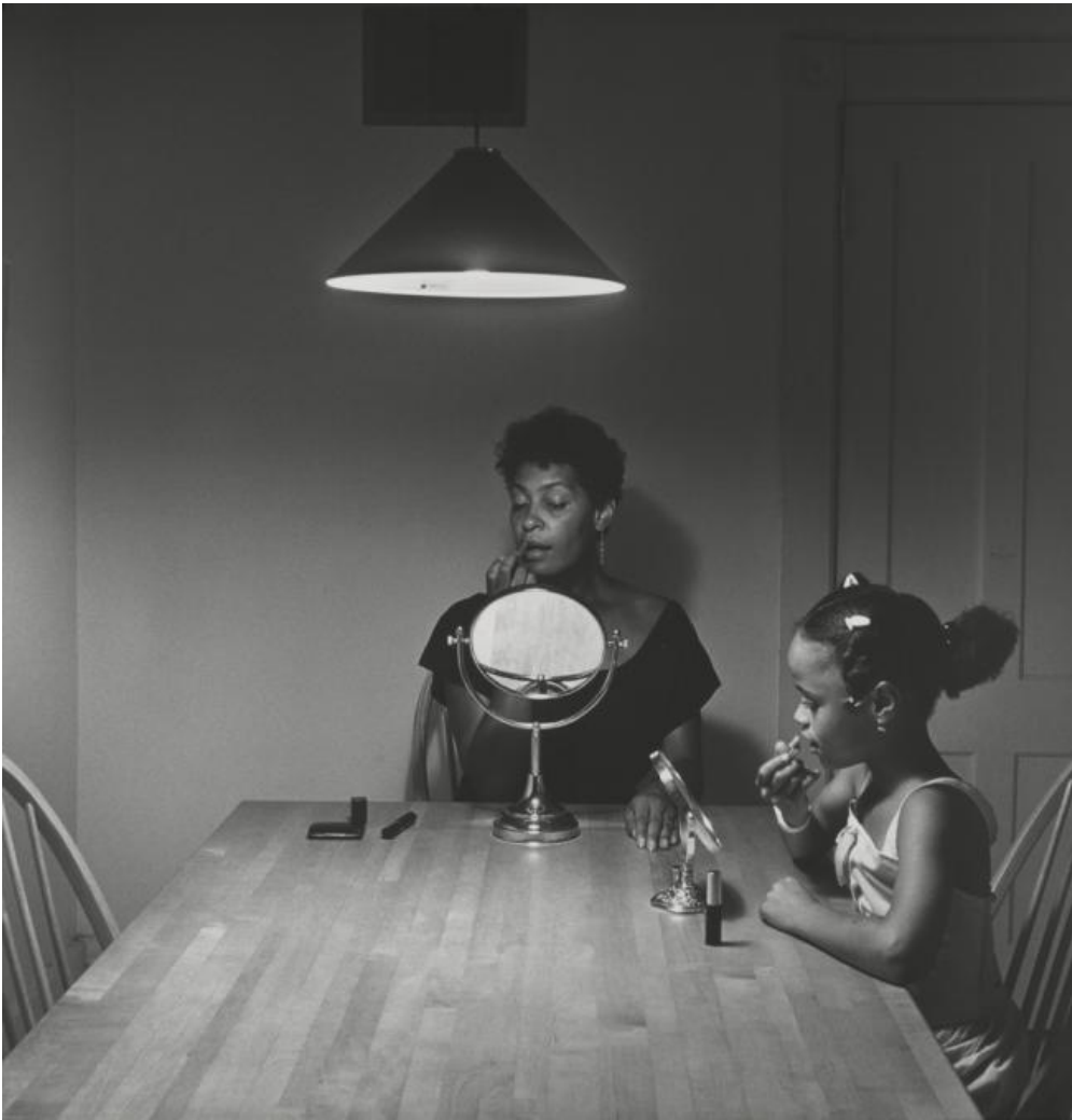
Carrie Mae Weems, Untitled (Woman and daughter with makeup) (from Kitchen Table Series ), 1990

Un mondo femminile, quello raccontato da Weems, che parla però un linguaggio universale. Perché quella donna di colore (da Kitchen Table Series , 1990), ritratta all'interno di uno scarso spazio domestico, di fronte a un tavolo da cucina, intenta in mansioni e ruoli diversi (madre, moglie, figlia, amica), oltre a narrare parte della sua biografia (il personaggio ritratto è infatti lei stessa), parla del ruolo della donna all'interno della struttura familiare e sociale contemporanea. Come cerchi concentrici, partendo dalla condizione femminile, la sua narrazione si amplifica, abbraccia le moltitudini umane: la donna diviene simbolo dell'emarginazione e della volontà di riscatto.