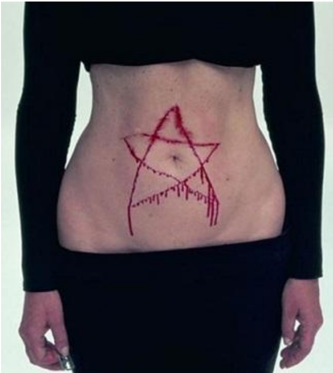
Marina Abramovic. Lips of Thomas. 1975

Parlano - ed è una scelta precisa, visto che alle donne è “sempre stato impedito di parlare altrimenti” -