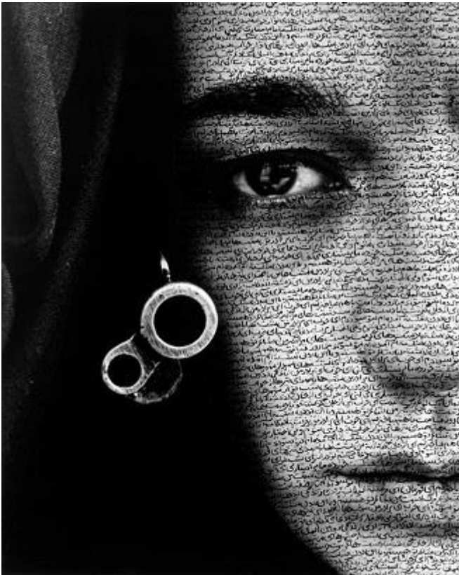
Shirin Neshat. Speechless. 1996

L'azione, va da sé, mette in conto il sacrificio ed è imparentata con la morte. Essere eroi e martiri non è cosa per tutte e per tutti, prevede ardimento e abnegazione o disperazione. L'azione militante è uno sport estremo: ci si immola solo per soldi o per sdegno, per interesse o per protesta.