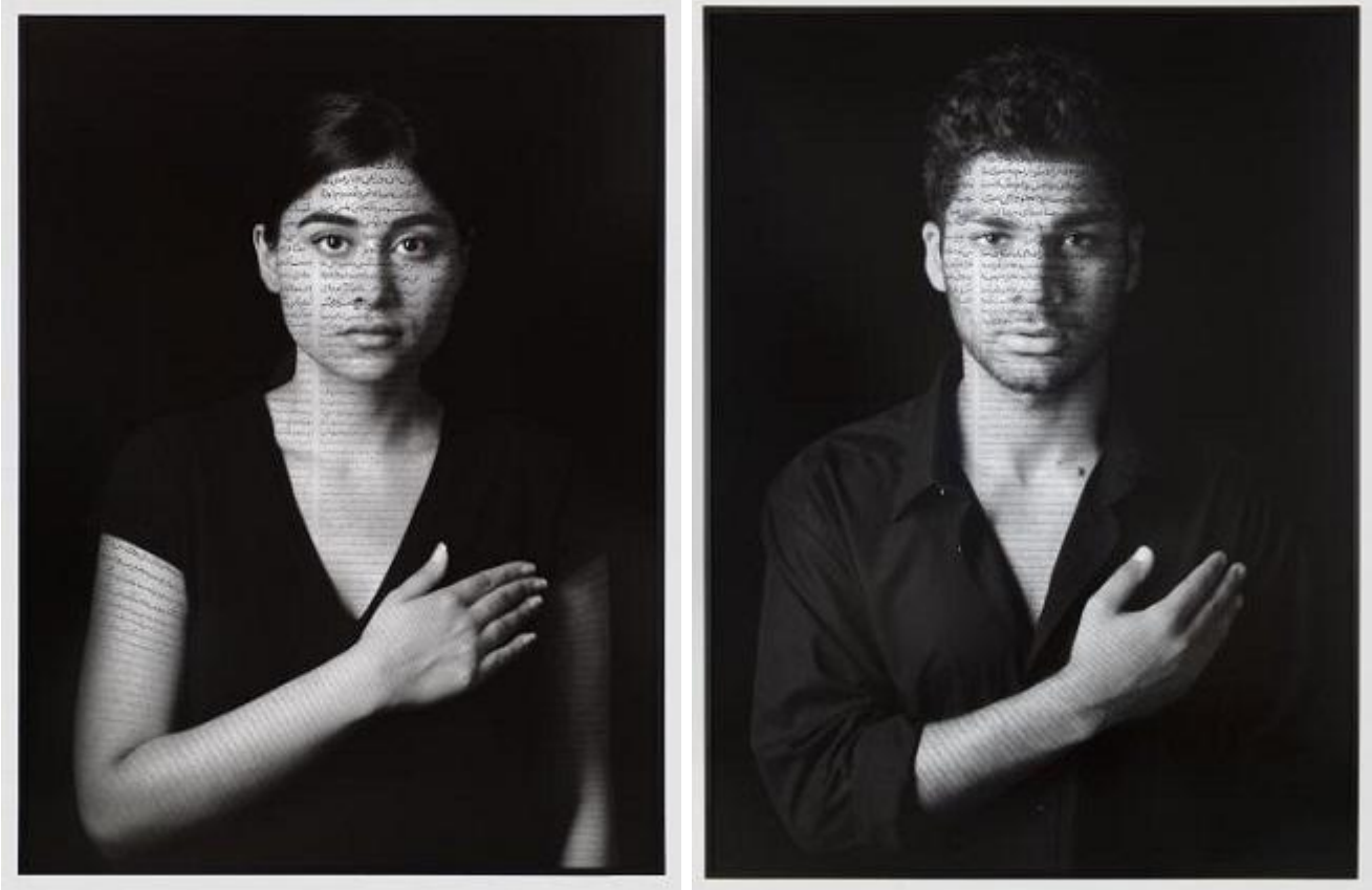
Shirin Neshat. Nida and Muhammed (Patriots), from The Book of Kings series, 2012

slogan, espressioni a dir poco icastiche, perché Femen è innanzitutto un marchio, un brand, qualcosa che deve forare la cortina mediatica, sbaragliare la concorrenza (delle idee? del mercato? del mercato delle idee? dell'idea di mercato?) e farsi strada fino al nostro inconscio e da lì fino alle nostre case. alle