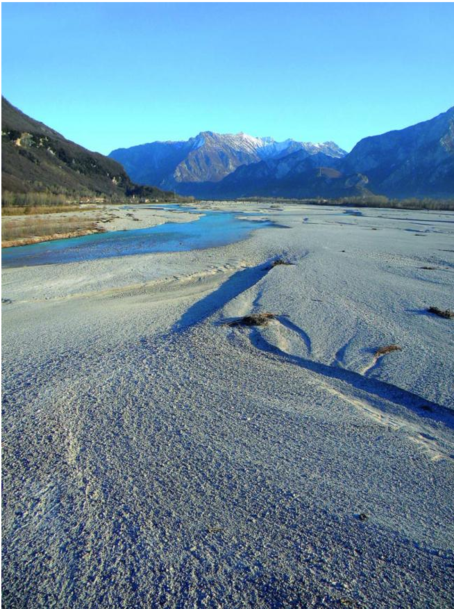
Ghiaia, Vivaro, PN

Ma “Alpe Adria senza” è anche, evidentemente, qualcosa in più. Testi scritti in un arco di tempo così ampio tradiscono una forma di raccolta di appunti personali, una sorta di diario di ossessioni e visioni private che emerge un po’ inaspettatamente.