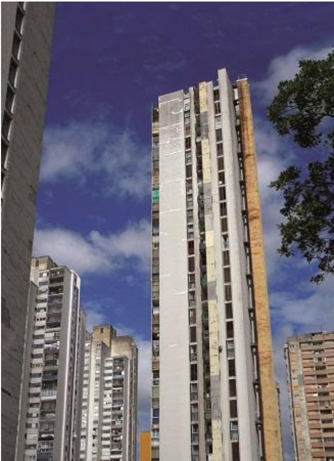
Grattacieli socialisti, Rjeka-Fiume (HR)

A sua volta però, il testo è frutto di un intreccio. Tra la descrizione delle cose visibili emerge continuamente un racconto di fatti sociali e politici, di scelte di singoli o di scelte collettive che configurano le ragioni profonde della modificazione dei paesaggi.