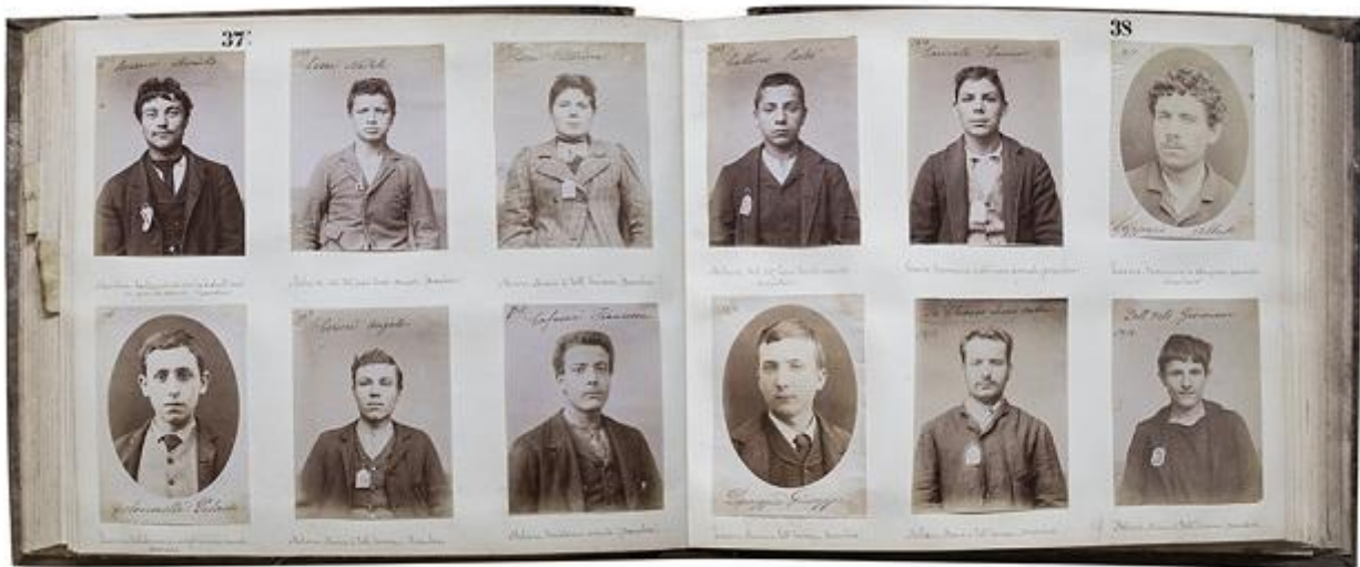
Fotografia - Festival Internazionale di Roma » Anarchici dall'Archivio di Stato

valore se esibito nella sua nuda essenza quale “riproduzione figurativa o fotografica delle sembianze di una persona” (dal Dizionario della Lingua Italiana Devoto-Oli): è la forma impressa a questa rappresentazione che può aprire il varco attraverso il quale l'esperienza visiva diviene un esercizio di apprendimento.