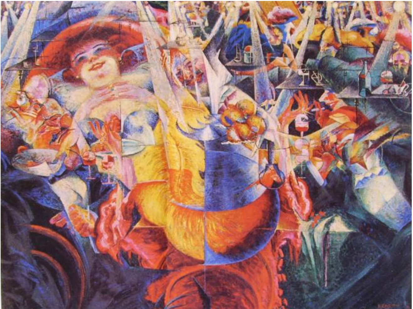
Umberto Boccioni, La risata, 1911

bisogno, in altri termini, di un'istanza superiore che le dia fondamento dicendone la verità, raccogliendone in proposizioni chiare e distinte un senso altrimenti balbettante. E nel farla finita col giudizio di Dio, l'empirismo radicale vuol farla finita col giudizio dei tanti succedanei di Dio. Con il soggetto e con l'uomo, per esempio. A cui la modernità ha assegnato lo stesso compito che la teologia tomista aveva dato all'essere supremo, quello di sorreggere da fuori una realtà inconsistente, di dare senso a un'esperienza di per sé insensata, elargendolo dall'alto del proprio statuto privilegiato e dalla propria eccezionalità.