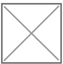
Basilica di San Vincenzo a Galliano, catino absidale

Ma questo dopo. Prima si può scendere e inoltrarsi tra le colline, seguendo strade e stradine che si assomigliano, in cui è facile perdersi dentro le ondulazioni del territorio, tra boscaglie e avvallamenti che limitano la vista e rendono incerta, ansiosa, la direzione, paesi senza capo né coda, cresciuti per germinazioni spontanee finché una parete scoscesa o una forra le ha interrotte, per riprendere