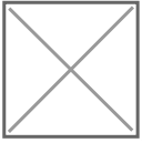
Basilica di San Vincenzo a Galliano, Martirio

qualcosa che deve essere raggiunto e conquistato prima di una scadenza avvertita come sempre imminente, e insieme già avvenuta, che la rovina stessa e gli affreschi scrostati segnalano e incarnano.