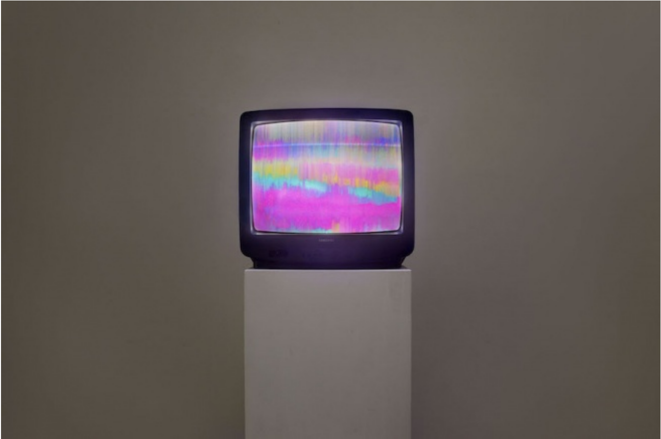
William E. Jones - Installation view. Ph. Lorenzo Palmieri. Courtesy the artist, Galleria Raffaella Cortese

sorta di trip oggettivo , un'allucinazione che appartiene solo all'immagine stessa e traduce le vicende convulsive attraversate dal suo supporto fisico manipolato. Una "sequenza di file digitali", e non semplicemente un video, perché il materiale originario, un nastro VHS ottenuto dai National Archives statunitensi, è stato acquisito e decomposto digitalmente da Jones, i frame selezionati e passati attraverso numerosi filtri di Photoshop fino a perdere ogni apparenza figurativa. Per gran parte della proiezione il quadro è in preda a una continua turbolenza di bande colorate, pattern geometrici, onde sfrangiate: un persistente rumore visivo in cui di tanto in tanto riusciamo a distinguere qualche elemento, anch'esso disturbato dal deterioramento dell'originale. Il sonoro giunge invece nitido ed è questo che permette di risalire al materiale di partenza, di capire quindi cosa Jones stia facendo a questo nastro, di cui troviamo le tracce sfigurate anche nell'altro lavoro in mostra, esibito in un piccolo monitor, Mission Mind Control .