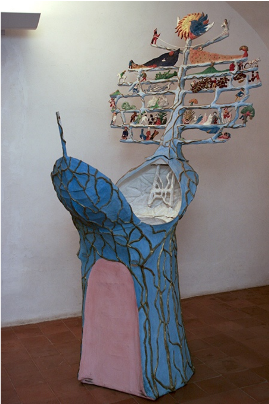
Il Teatro Vagante, 1978/1980: albero, carro, grotta, culla, veliero, albero del tempo e teatro