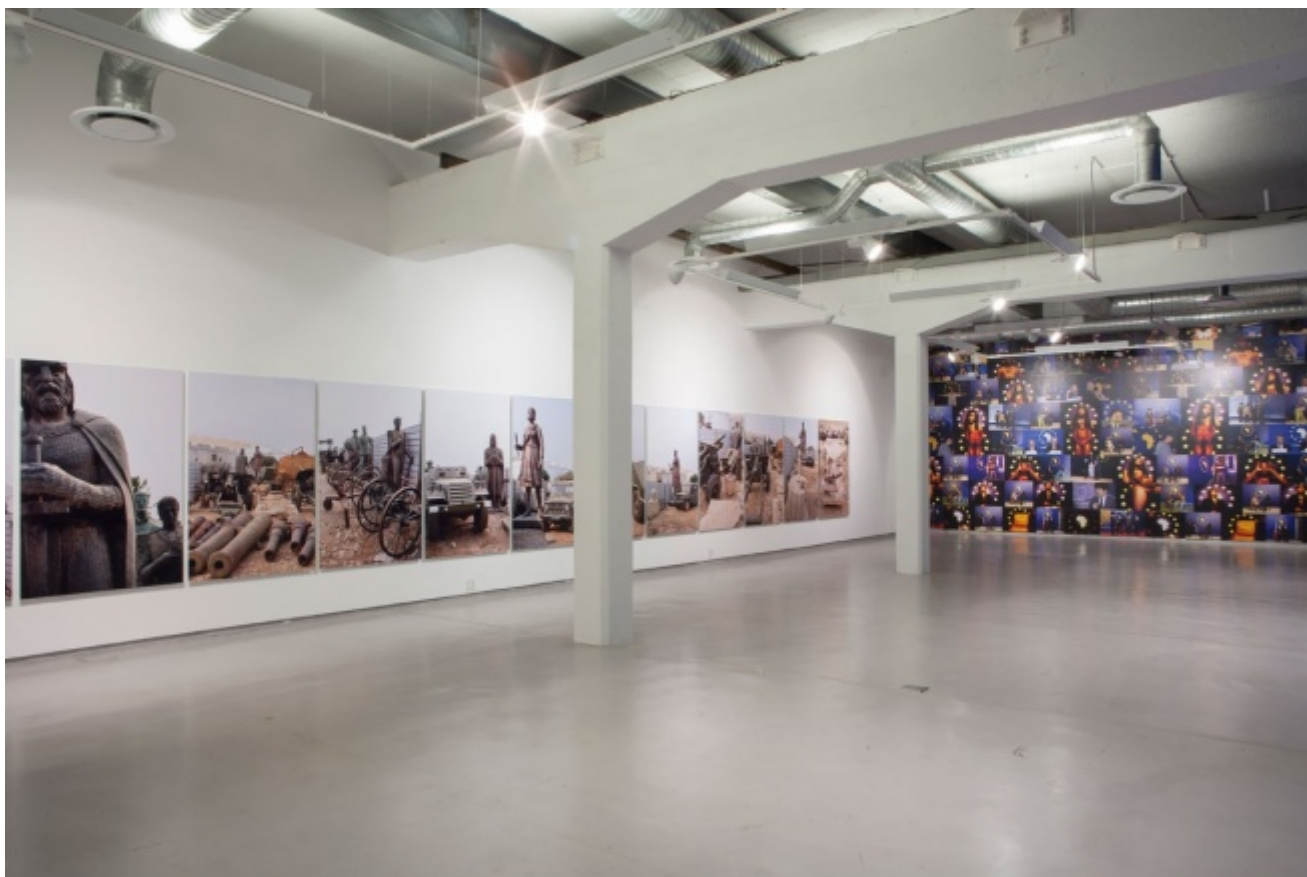
Un'immagine della mostra (2014) di Kiluanji Kia Henda, As God Wants and the Devil Likes It . Per gentile concessione della galleria Brundyn+, Città del Capo

Basate principalmente sull'uso del mezzo fotografico, le opere di Henda ruotano intorno alla rappresentazione dell'Africa, al passato e al futuro del continente. La sua mostra dal titolo As God Wants and the Devil Likes it , tenutasi lo scorso settembre alla galleria Brundyn+ di Città del Capo, è una riflessione sulle