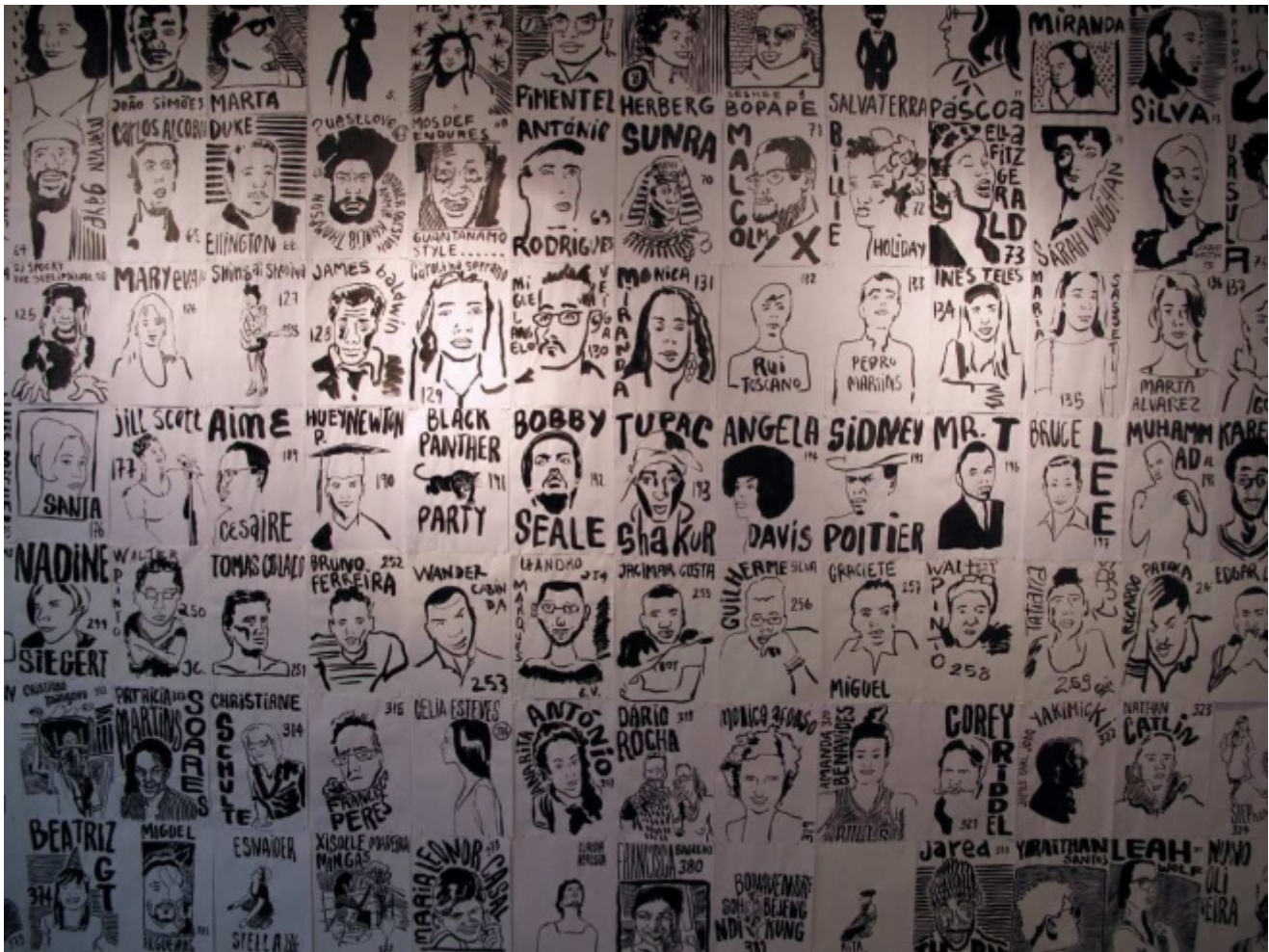
Francisco Vidal. Installazione. Per gentile concessione dell'artista

La pratica artistica di Vidal attraversa una pluralità di mezzi espressivi – tra cui disegno, scultura e installazione – per riflettere sulla realtà che lo circonda. La sua ricerca verte intorno ai concetti di razza, differenza, negritudine e diaspora africana.