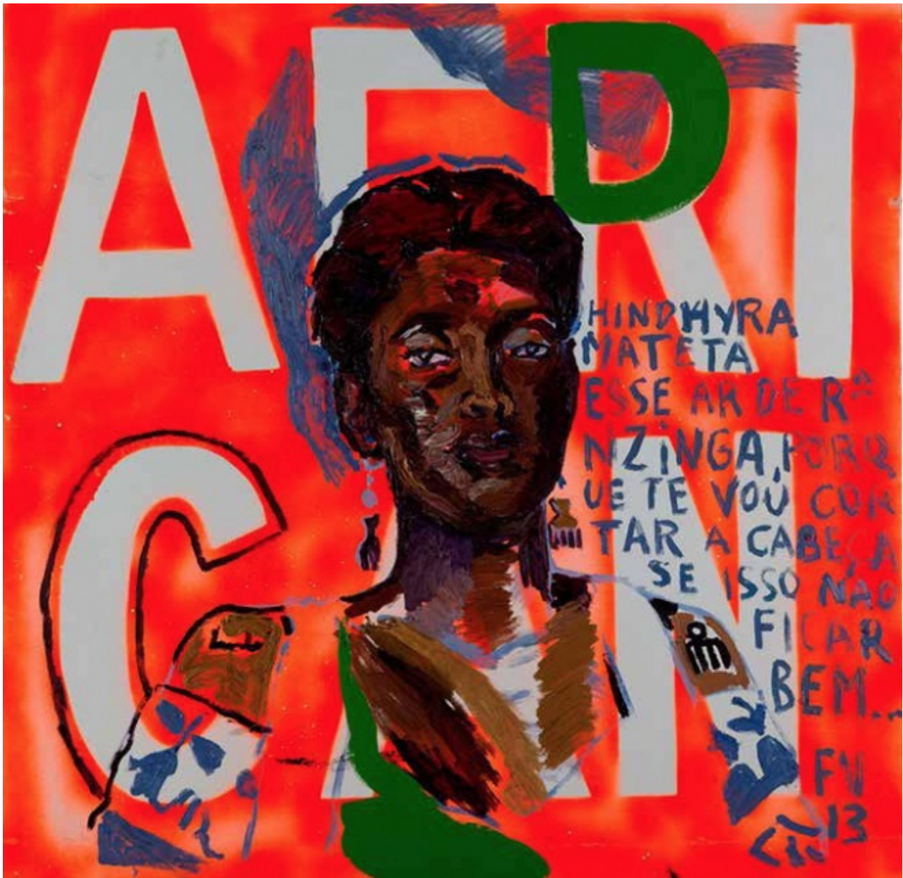
Francisco Vidal. Hindyra Mateta, Luanda, 2013.

Al centro della sua opera è anche l'esplorazione del suo stesso patrimonio culturale. Nato a Lisbona da madre capoverdiana e padre angolano, egli si considera la manifestazione vivente della creolizzazione prodotta dalla storia coloniale, l'incarnazione della fusione culturale di tre paesi diversi, politicamente e storicamente connessi.