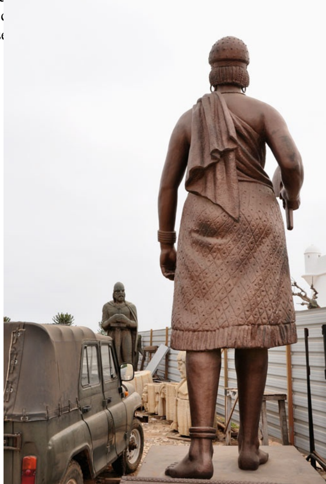
Kiluanji Kia Henda. Balumuka (Agguato), 2010. Per gentile concessione dell’artista e della Galleria Brundyn+, Città del Capo

Matthew Blackman, direttore della rivista sudafricana Arththrob , descrive il progetto Icarus 13 – nel quale Henda documenta il tentativo (fittizio) del governo angolano di inviare quattro astronauti sul sole – come “uno dei progetti più profondi e creativi degli ultimi dieci anni”.