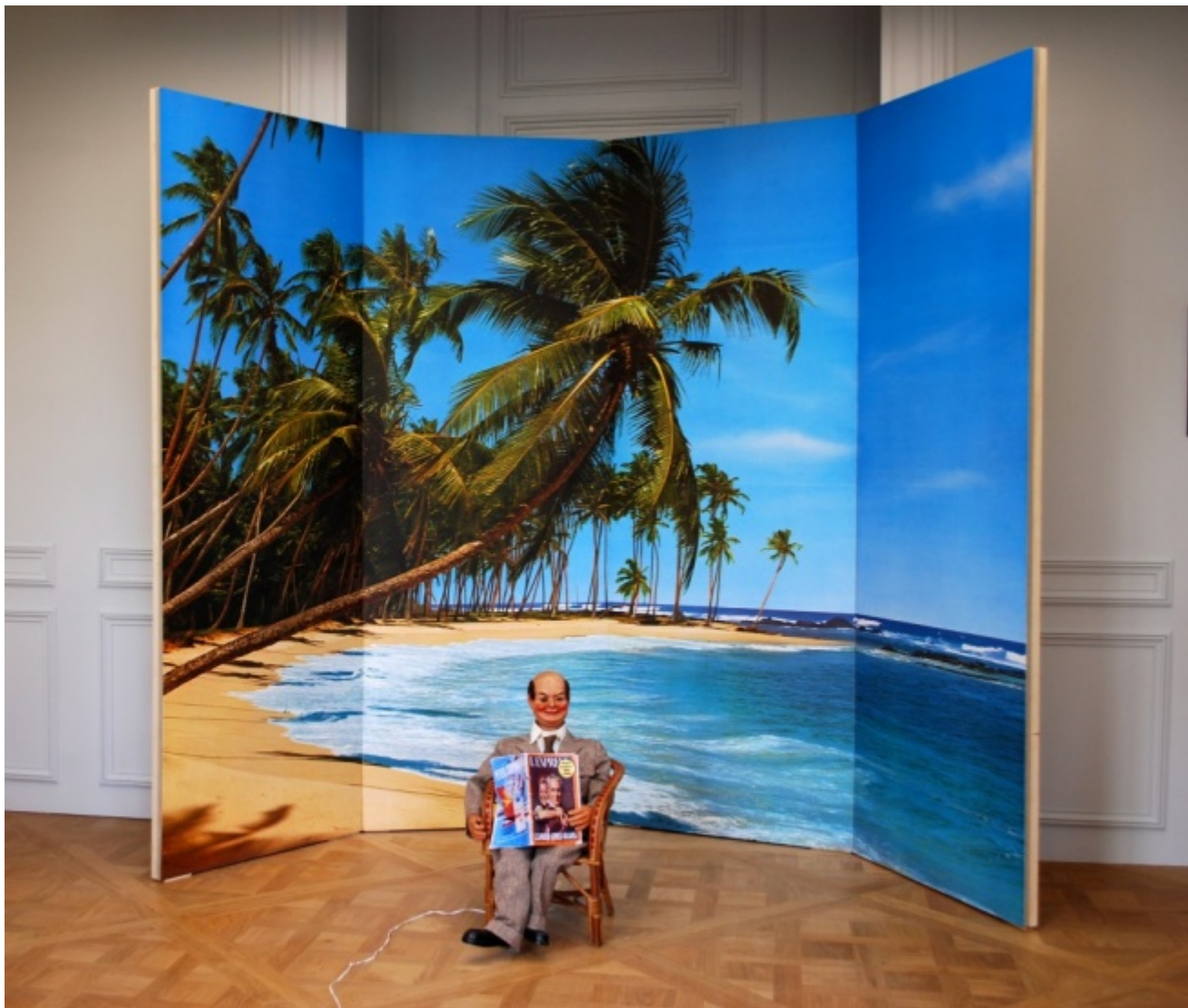
Marcel Broodthaers, Monsieur Teste, 1975

Broodthaers ha messo il paratesto museale al cuore della sua pratica artistica – una gioiosa messinscena del fenomeno artistico. Museo, Dipartimento, Sezione: una tassonomia culturale, ordinata in modo gerarchico, che rende visibile l'equazione tra l'idea dell'arte e l'idea di potere (Thierry de Duve). E che non dimentica le ragioni della poesia: a Broodthaers bastò cancellare qualche lettera per trasformare una Carte du monde politique in una Carte du monde poétique (1968). Il poeta che diventò guardiano del suo museo ci ha lasciato un lavoro inclassificabile che non si risolve né nell'immaginario surrealista né nelle fredde tavole dell'arte concettuale ma si situa in un entre-deux visivo e linguistico inesplorato. Una gerenza poetica dell'esistente, dall'Oligocene ai nostri giorni perlomeno.