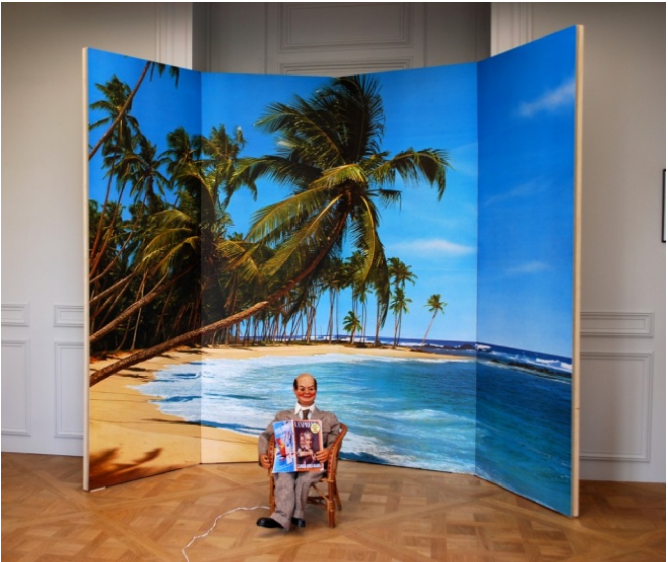
Marcel Broodthaers, Monsieur Teste, 1975