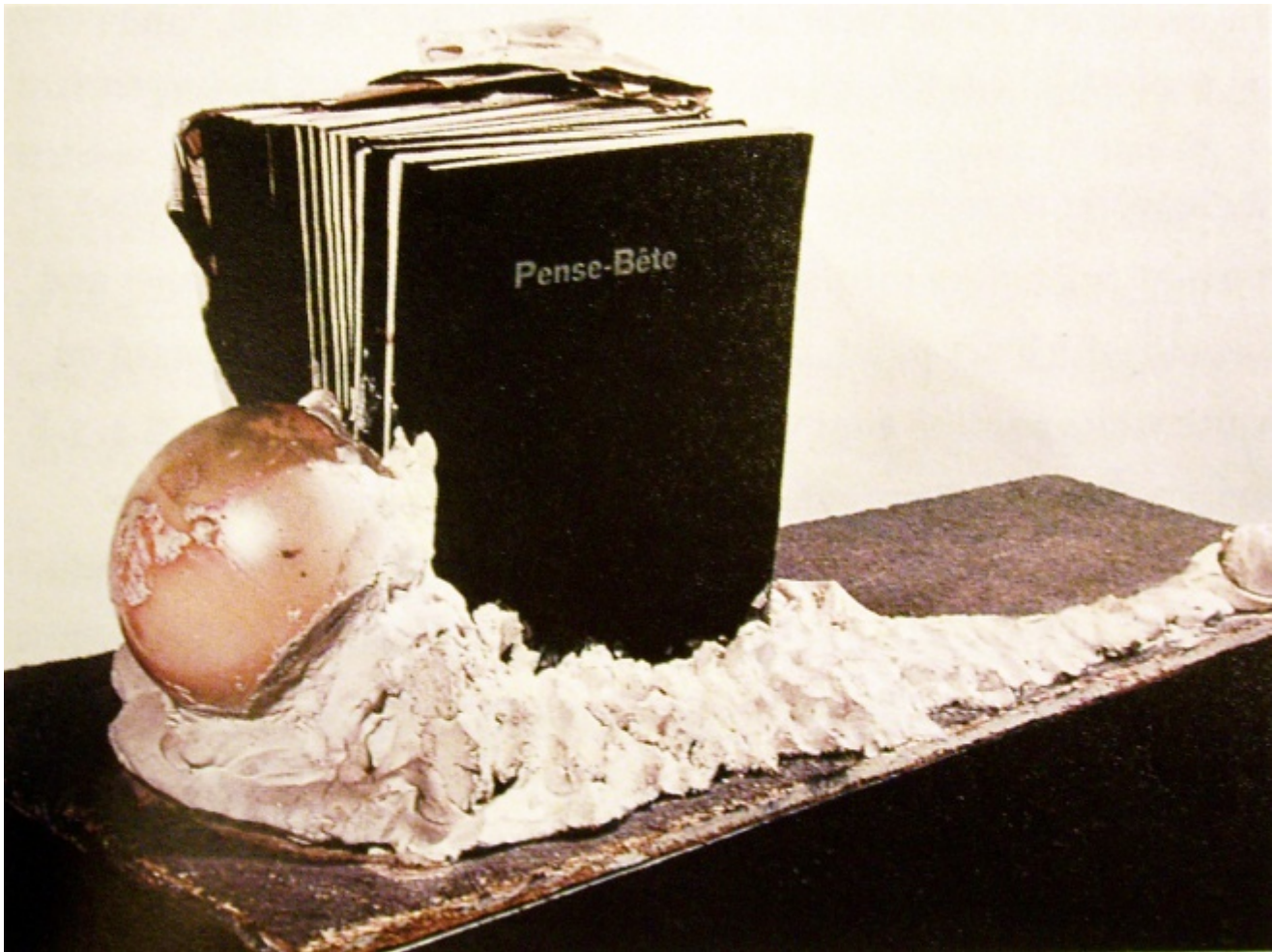
Marcel Broodthaers, Pense-Bête , 1964

deliberato, pianificandolo “a tavolino” come si risolve un’equazione. I lettori dei libri di poesia, si sa, sono scarsi, troppo parchi e astratti da immaginare. Il poeta si chiese così se anche lui poteva conferire una dimensione collettiva al suo lavoro, conquistare un vero pubblico, inventarsi qualcosa d’insincero, insomma vendere qualche cosa.