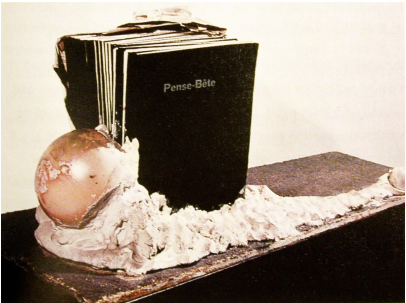
Marcel Broodthaers, Pense-Bête, 1964

Chi osò tanto? Un poeta che a quarant'anni, alla fine del 1963, decise di diventare artista. Non lo fece per ispirazione, per placare qualche demone interiore che gli tormentava l'animo, ma in modo del tutto deliberato, pianificandolo "a tavolino" come si risolve un'equazione. I lettori dei libri di poesia, si sa, sono scarsi, troppo pochi e astratti da immaginare. Il poeta si chiese così se anche lui poteva conferire una dimensione collettiva al suo lavoro, conquistare un vero pubblico, inventarsi qualcosa d'insincero, insomma vendere qualche cosa.