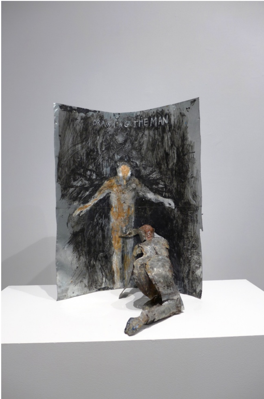
June Leaf, Donna che disegna l'uomo, 2014

Se gli appellativi potessero essere tradotti, nella nostra lingua si chiamerebbe ‘foglia di giugno’. E delle foglie di primavera questa artista – nata a Chicago nel 1929, oggi si divide tra New York City e l’Isola di Cape Breton, Nuova Scozia, insieme al marito, il fotografo Robert Frank – ha la tenacia fragile e vibrante. Poco nota fuori dagli Stati Uniti e dal Canada e ancora non del tutto riconosciuta nella sua schiva grandezza, Leaf ha dedicato la vita a tracciare con sguardo fermo e mano giocosa e austera una specie di verbale dell’inconscio, il proprio e l’altrui.