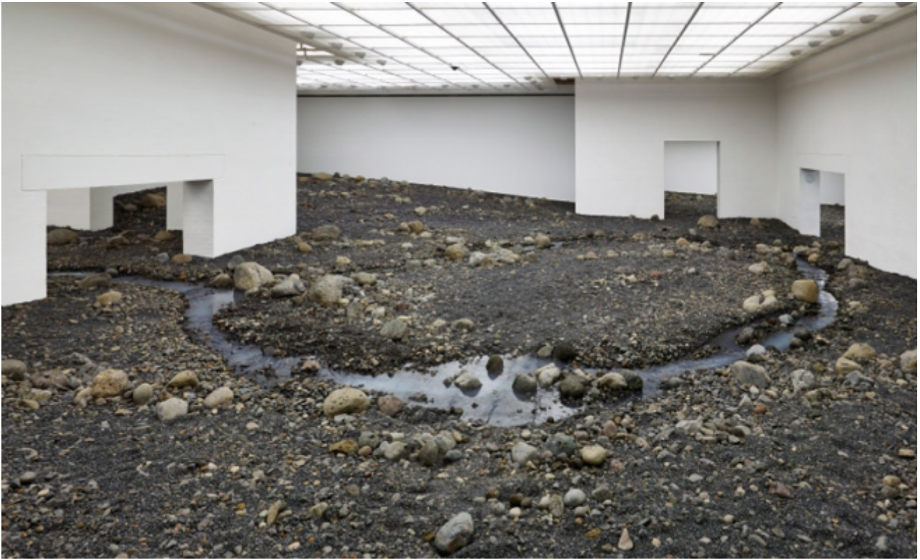
Olafur Eliasson, Riverbed, 2014