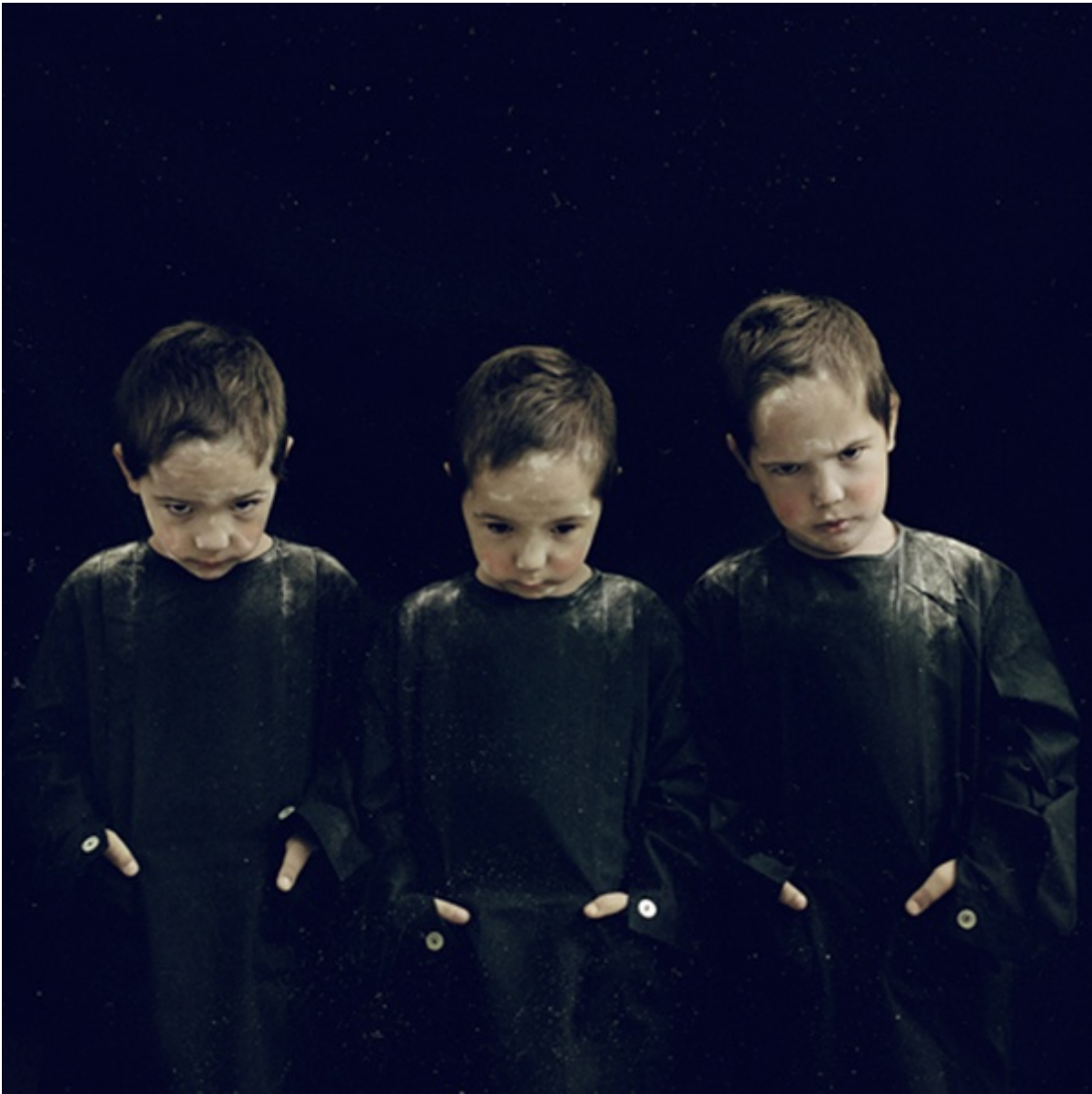
Dall'alto: An opening Song; Shadows on Parade

Però hai detto che non ti interessa ritrarre quello che vedi.