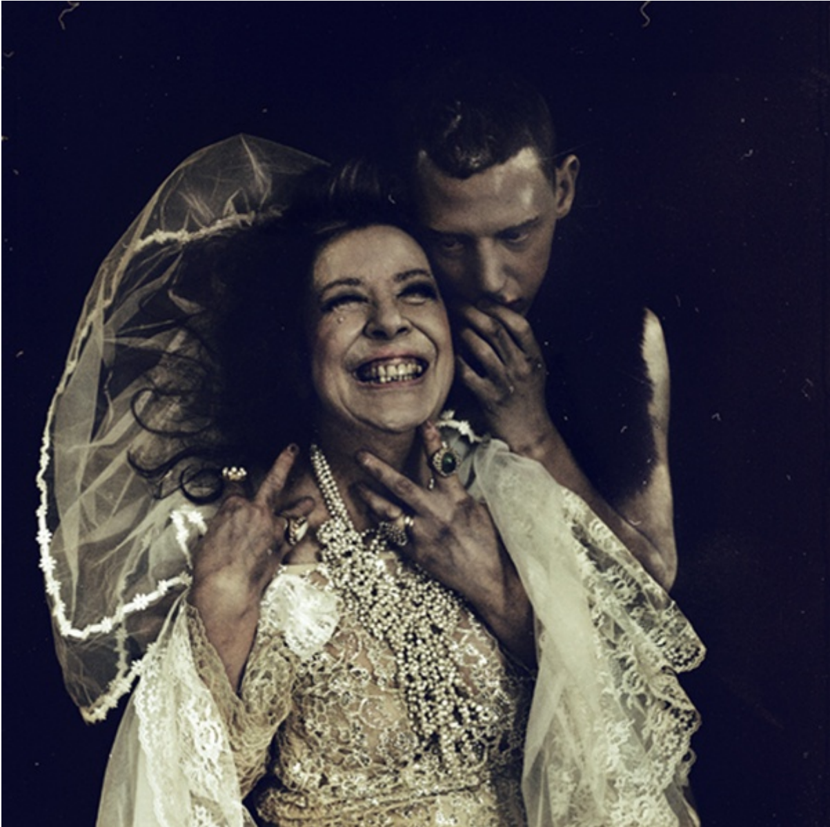
Shadows on Parade

Da Roma a Londra. Che cos'è che ti ha portato qui?