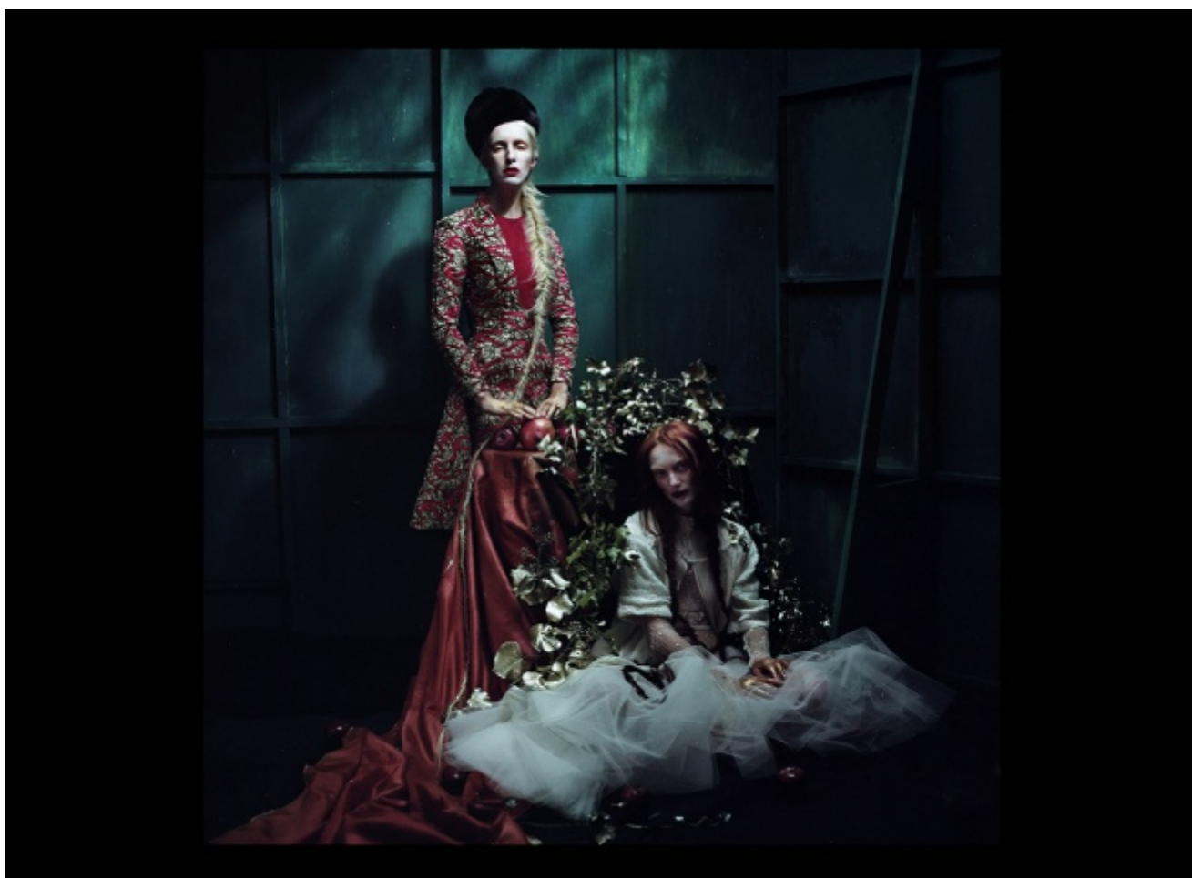
A Study in Red and Gold, 2015