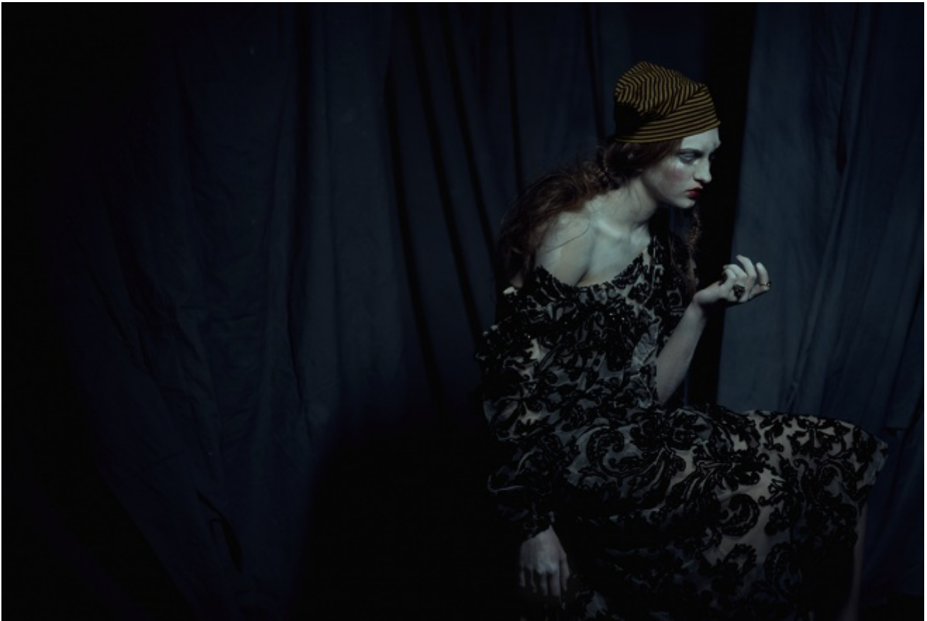
Shooting for Grey Magazine, 2015