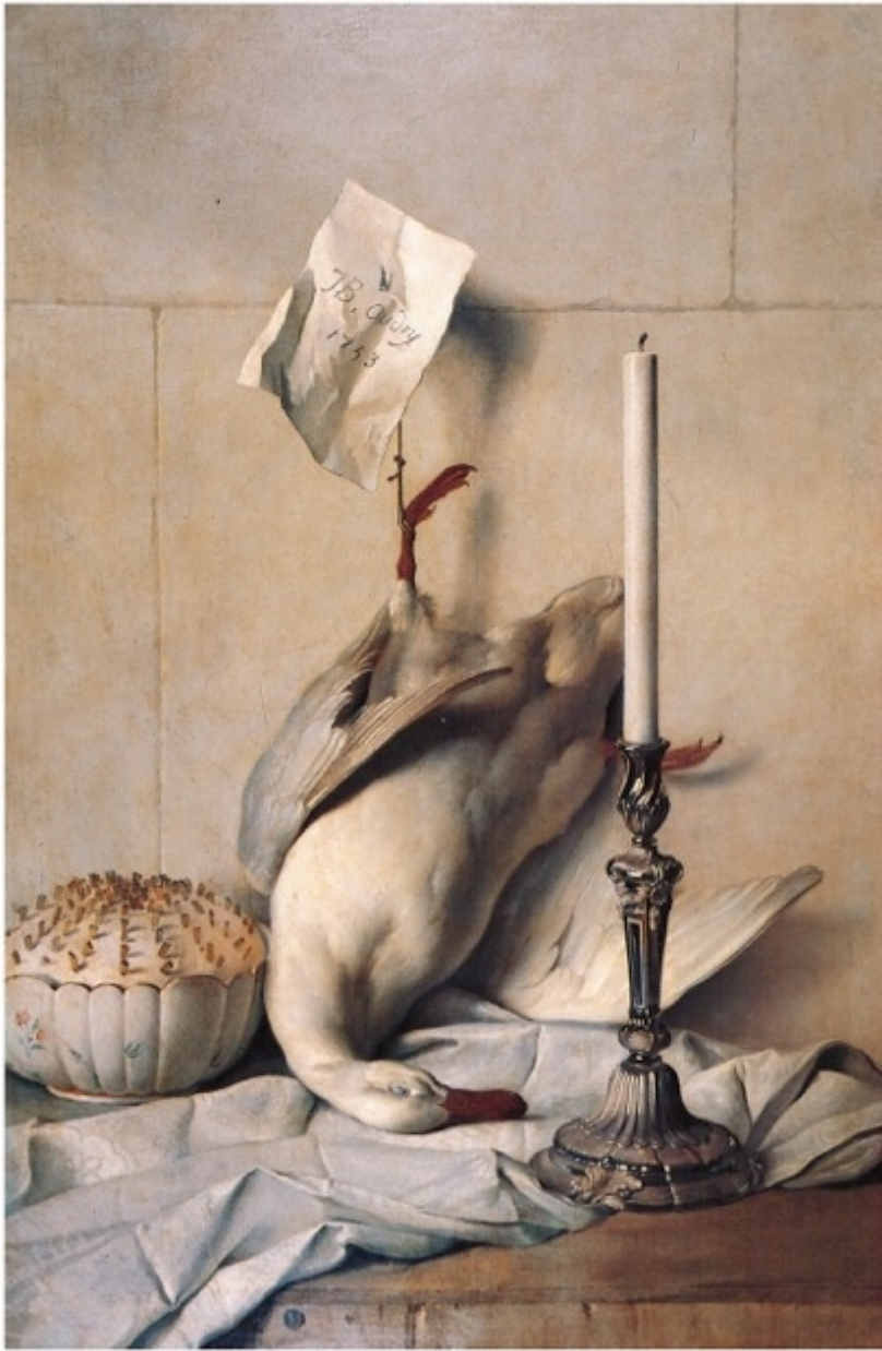
Jean-Baptiste Oudry, Le Canard blanc , 1753

Nel caso del quadro quindi le parti divengono più chiare o più scure nel gioco dell'armonia e del contrasto dei colori stesi sulla carta oppure in relazione ai pezzi di carta lasciati bianchi; ma, per altri versi, noi classifichiamo i colori in colori chiari e colori scuri e li sistemiamo nella scatola delle matite o sulla tavolozza secondo il criterio che va dal chiaro allo scuro. Insomma il colore più chiaro è sempre il bianco, ma il bianco non è sempre il colore più chiaro. L'enigma – il filosofo lo chiama proprio così – deriva dal fatto che i colori non si lasciano sistemare in un solo e unico ordine.