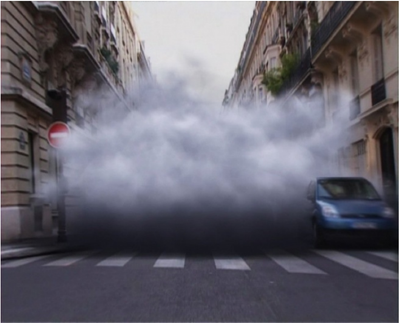
Laurent Grasso, Projection, 2005

Nell'“exposition” percepiamo l'atto di esporci – come ci esponiamo ai raggi X o alla pioggia – la condizione rischiosa dell'esposizione, lontana dalla tutela delle opere d'arte nei musei. Teche di vetro, parapetti, cordoni di sicurezza, allarmi, dispositivi termici, sensori a infrarossi, telecamere a circuito chiuso, centri remoti di monitoraggio, guardiani che presidiano le sale. Un sistema tecnologicamente impeccabile che previene umidità, parassiti, usura, incendi, deflagrazioni, furti, atti vandalici, effrazioni.