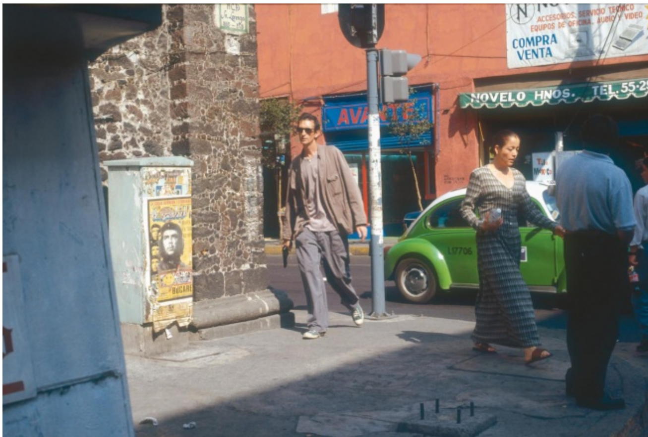
Francis Alys, Reenactment, 2000

strade di Città del Messico in pieno giorno prima di essere fermato, undici minuti dopo, dalla polizia. Ripenso a quella nuvola che avanza per le strade deserte di Parigi e copre le macchine parcheggiate quanto le insegne dei negozi in Projection (2005) di Laurent Grasso. Ripenso persino a Air de Paris (1919) di Marcel Duchamp che, dietro l'apparente neutralità dell'ampolla farmaceutica, evoca la diffusione delle maschere a gas durante la Prima guerra mondiale.