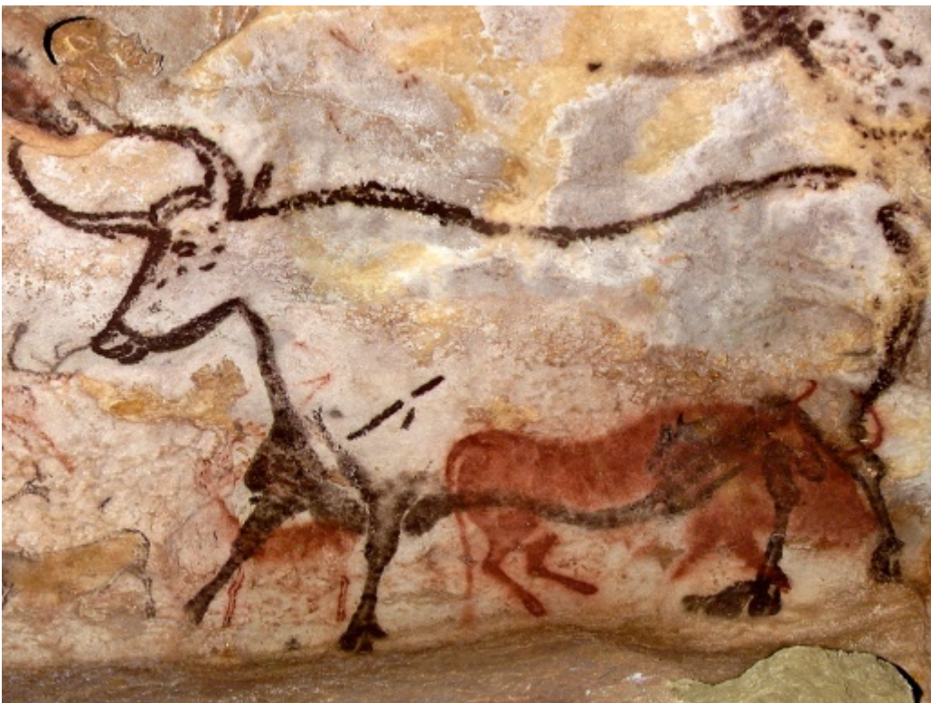
Grotte di Lascaux

sue riflessioni più significative rimane questa, in qualche modo sentenziosa: « soltanto ciò che ho disegnato ho veramente visto ». Concetto che riprese anche Valéry, sostenendo che solo disegnando si riesce a vedere ciò che diversamente ci è precluso di vedere, perché la pratica del disegno pone come condizione “la distruzione della visione abituale”. Anche Konrad Fiedler (1841-1895) importantissimo filosofo e critico, sosteneva che « E' sbagliato dire che tutti sanno vedere, e non tutti sanno disegnare: in questo modo si scindono le due cose come alquanto di differente, mentre si tratta solo di diversi stadi di una stessa attività » [6]. Un'affermazione che rivela quanto, anche agli occhi di uno studioso e critico del lavoro degli artisti, risulti evidente oltre che vera. Così, ancora, Michelangelo, che, alle richieste dei giovani apprendisti di bottega di rivelare il segreto del saper disegnare, rispondeva loro che « Sa disegnare soltanto chi possiede la seste negli occhi », intendendo che bisognava saper usare gli occhi per confrontare le dimensioni e le forme nello stesso modo in cui allora gli scultori facevano con il loro compasso - la seste - riportando dal bozzetto le dimensioni della figura sul blocco di marmo: un'attività che andava eseguita con assoluta precisione, perché da essa dipendeva la sicurezza della mano dello scultore.