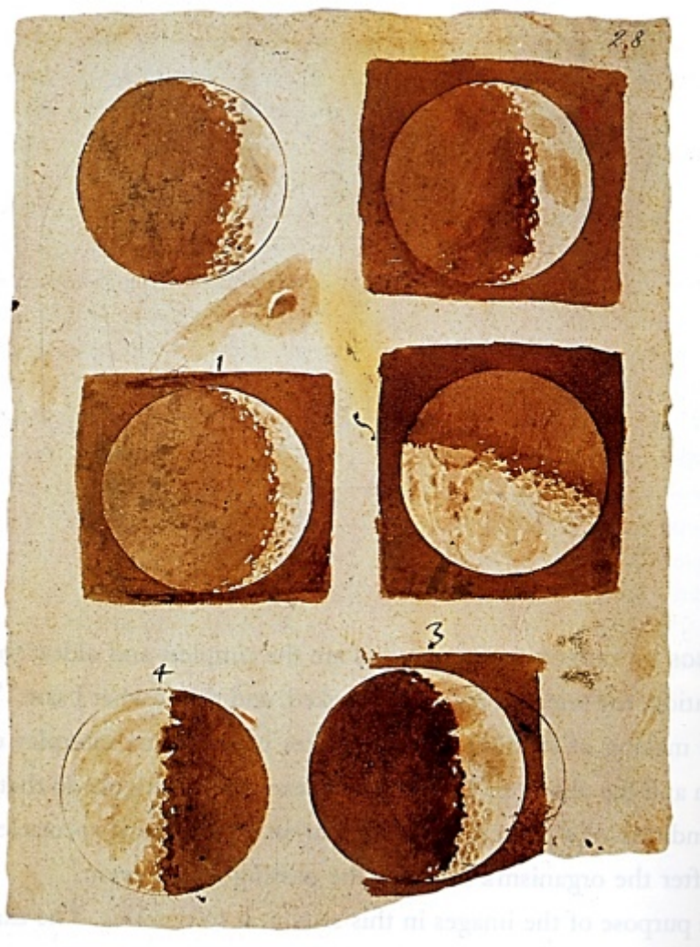
Galileo Galilei, Disegni della Luna, Sidereus Nuncius, 1610

L'occhio di Galileo riuscì a vedere ciò che altri non vedevano, e - come il cardinale Roberto Bellarmino - si ostinavano a non voler vedere, perché era un occhio da disegnatore: applicando la teoria delle ombre a ciò che vedeva ne dedusse conoscenze fondamentali, che comportarono per tutta l'umanità una grande conquista.