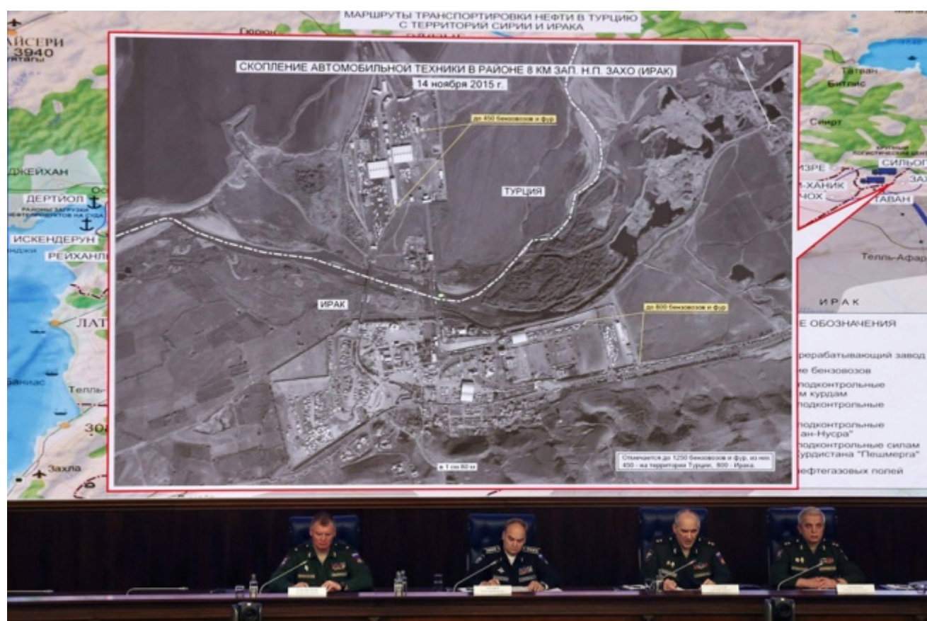
Conferenza stampa del viceministro della difesa russo Anatoly Antonov

In seguito all'abbattimento di un velivolo dell'aviazione militare russa al confine tra Siria e Turchia, i rapporti tra Russia e Turchia si sono deteriorati. Il presidente della Federazione Russa Putin accusa il presidente del governo turco Erdoğan di acquistare petrolio a basso costo dall'Isis. La Turchia è "il consumatore principale di questo petrolio rubato ai proprietari legittimi della Siria e dell'Iraq", ha comunicato in una conferenza stampa il vice ministro russo della Difesa Anatoly Antonov, aggiungendo che il presidente Erdoğan e la sua famiglia sono direttamente coinvolti in questa attività criminale. L'attività estrattiva, che costituisce la maggiore fonte di finanziamento dell'Isis, oltre ad avere un rilievo economico ne ha anche uno simbolico.