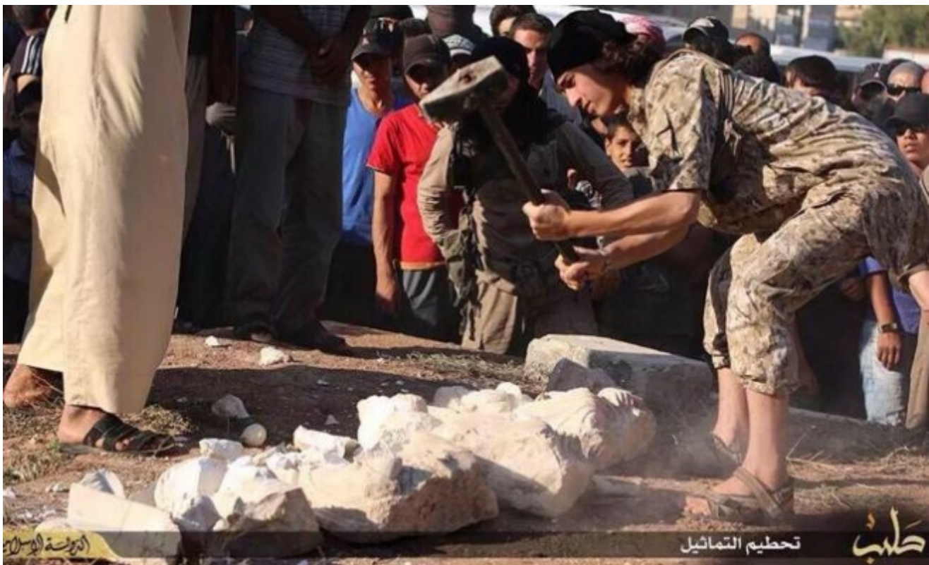
Distruzione di statue a Palmira

Il libro XXXIII di Storia Naturale si apre così con una condanna alla violenza – non risarcita – inflitta alla terra nostra genitrice, ma più avanti (libro XXXIV), leggendo le prime pagine di quella che diventerà Storia dell’Arte , scopriamo che la violenza inflitta con le attività estrattive può essere risarcita dalla perfezione e dalla bellezza delle statue modellate, fuse, cesellate e scolpite da Fidia, Lisippo, Prassitele, Policleto “l’unico ad aver teorizzato l’arte con un’opera d’arte” (il Doriforo ) e tanti altri artisti che hanno contribuito alla gloria della scultura. La perfezione e la bellezza sostituiscono il sacrificio come tributo dovuto alla terra che violiamo con le attività estrattive. Il risarcimento alla terra genitrice ora ha luogo non solo nei campi coltivati ma anche nelle officine di scultura ubicate nelle città. Tra queste Palmira, la “sposa del deserto” che raggiunge il suo massimo splendore negli stessi anni in cui Plinio la descrive in Storia Naturale : “città famosa per la posizione, piacevole per le ricchezze del suolo e per le acque, racchiude in un ampio tratto campi con sabbia da ogni parte e, come isolata dalle terre dalla natura, è in una condizione particolare fra i due sommi imperi dei Romani e dei Parti, sempre preoccupazione per entrambi alla prima discordia”.