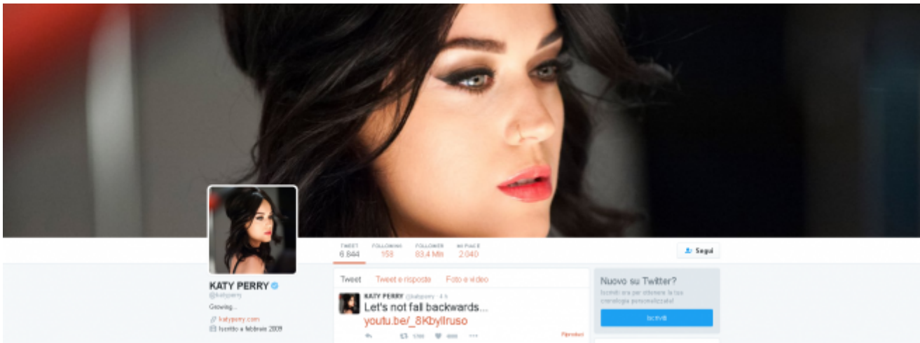
Katy Perry su Twitter

La maggior parte opta per le immagini del profilo con il faccione in primo piano, dove le opposizioni in gioco sono: istituzionale vs finta sorpresa, comicità spinta vs ammiccamento andante. Ci sono anche casi di piano medio e figura intera, ma si tratta di fotografie più elaborate.