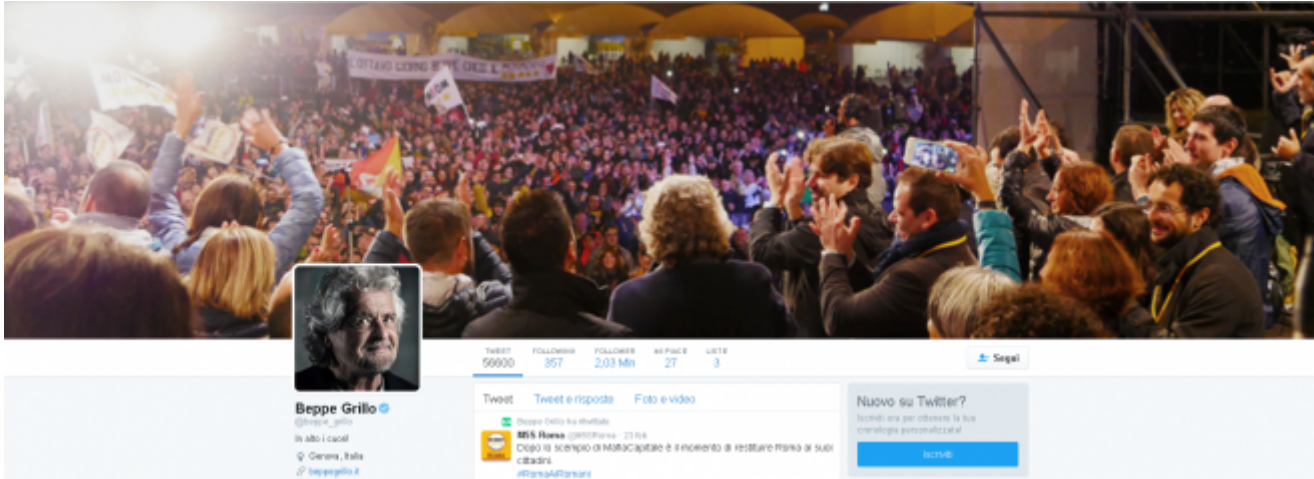
Grillo su Twitter

un padre per confortare i figli, ruolo che Grillo sembra voler ricoprire con i suoi seguaci, anche se Mario Bordin, in un suo pezzo del 2013 su Il foglio , ha ricollegato il motto all'inno delle camicie brune. Rimanendo nel campo della retorica del pater familias, un ulteriore spunto d'analisi proviene dalla copertina, che vede in primo piano una folla adulante di pentastellati, mentre Grillo e gli altri esponenti del partito-non-partito sono ripresi di spalle, intenti ad applaudirli. Se triangoliamo questa immagine, “in alto i cuori” e la risposta dell'assemblea “sono rivolti al Signore”, l'equazione è presto fatta: Grillo sta ai suoi seguaci come il buon pastore alle sue pecorelle. Fedez come Grillo continua con l'accoppiata sostenitori più foto personale, per dimostrare che loro sono la gente e la gente è loro, in tutti i sensi.